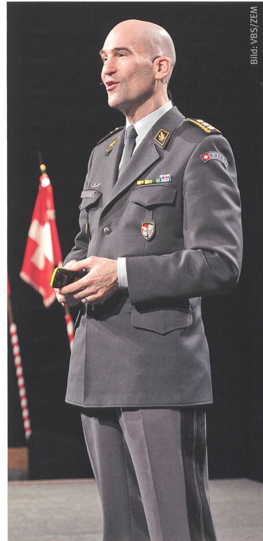
KKdt Thomas Süssli, Chef der Armee.

jüngste Schlacht um Mossul miterlebte, was nur «eingebettet» möglich war, also zusammen mit der irakischen Armee, die den «IS» bekämpfte. Seine Bilder lassen sich am ehesten mit jenen aus dem Zweiten Weltkrieg von der Schlacht um Stalingrad vergleichen. Diese Wirklichkeit