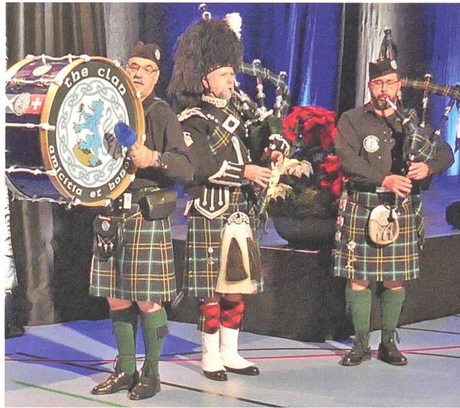
Schwungvolle Klänge von Luzerner Schotten.