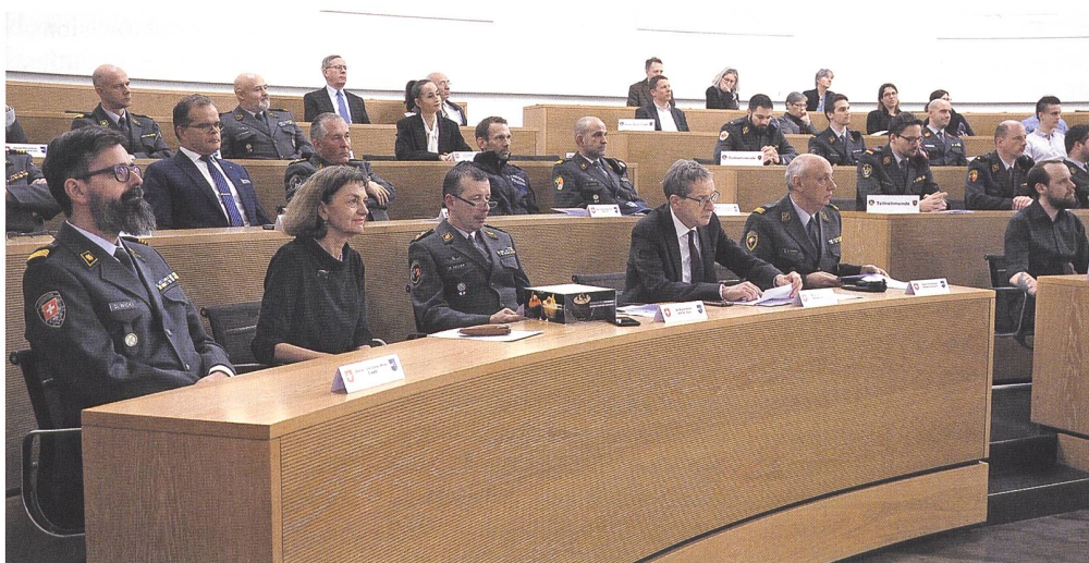
Verabschiedung im Grossratsaal in Aarau.

Anlässe dieser Art sind Ausdruck jener Kultur, die Henri Guisan meinte, als er seinen oft wiederholten Vortrag hielt «Unser Volk und seine Armee».