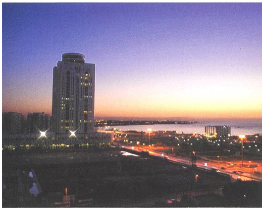
Die libysche Hauptstadt Tripolis.

Verheerend ist die Situation in Libyen auch für hunderttausende Flüchtlinge, die in Internierungslagern gestrandet sind. Bereits seit Jahren ist Libyen eines der wichtigsten Transitländer für Flüchtlinge und Migranten aus afrikanischen Ländern, die nach Europa weiterreisen wollen. Als im Jahr 2016 über 170 000 Flüchtlinge aus Libyen an Italiens Küsten angekommen waren, verhandelte die italienische Regierung