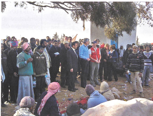
Das IKRK mit Flüchtlingen an der tunesisch-libyschen Grenze.

Beide libyschen Kriegsparteien sind aktuell davon überzeugt, den Bürgerkrieg in Libyen gewinnen zu können und daher nicht zu einem Waffenstillstand bereit. Den hatte Ende 2019 die deutsche Bundeskanzlerin, Angela Merkel, nach einem Telefonat mit Russlands Präsident Wladimir Putin gefordert. Russische Söldner der