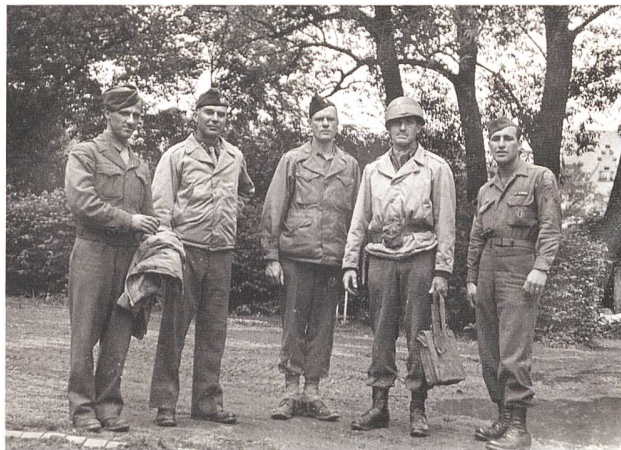
The Monuments Men.

In diesem Artikel wird versucht, eine Brücke zu schlagen und die Anregung in den Raum zu stellen, den zivilen Ersatzdienst für Gewissensgründe beizubehalten, gemäss Art. 59 BV der Bundesverfassung. Für andere «Ausstiegsgründe» ist