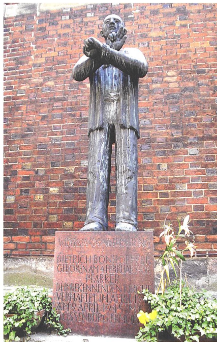
Denkmal für Dietrich Bonhoeffer; Hamburg, St. Petri-Kirche.