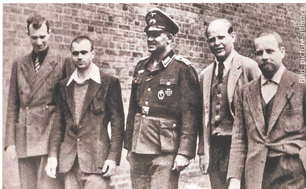
Dietrich Bonhoeffer (2. v. r.) im Gefängnis Berlin-Tegel, mit italienischen Mitgefangenen und einem Gefängniswärter.

Am 3. April 1943 wurde der Sonderermittler Manfred Roeder, Richter der Luftwaffe, mit dem Fall betraut. Hermann Goering war persönlich interessiert, nach der Aufdeckung der «Roten Kapelle» in seinem Verantwortungsbereich, einen