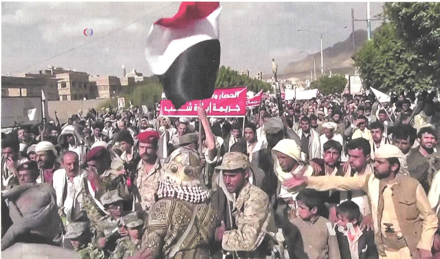
Huthis in Jemen demonstrieren gegen Luftschläge Saudi-Arabiens.

beschreiben die humanitäre Situation im Jemen als die «schlimmste humanitäre Krise der Welt», sprich: sogar gravierender als in Syrien. So könnte das Coronavirus dramatische Folgen historischen Ausmasses für den Jemen haben, denn das Gesundheitssystem ist bereits kollabiert und viele Epidemien haben sich verbreitet: Cholera, Dengue-Fieber und andere Krankheiten. Dazu kommen die Hungersnot, Unterernährung und die anderen humanitären Folgen des Krieges für die Bevölkerung. 6