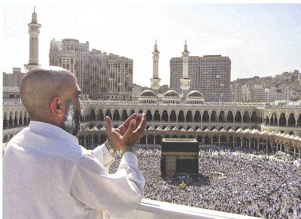
Der Haddsch nach Mekka wird 2020 wegen Corona abgesagt.

Die Corona-Pandemie von historischem Ausmass kann als weltweiter sicherheitspolitischer Katalysator fungieren und zahlreiche sicherheitspolitische Probleme mit weitreichenden Folgen auslösen: Potenziell fortgesetzte und sogar noch intensiviertere Kriege, eine Verstärkung von Konflikten wie beispielsweise zwischen Saudi-Arabien und dem Iran, Bürgerkriege und humanitäre Katastrophen. ■