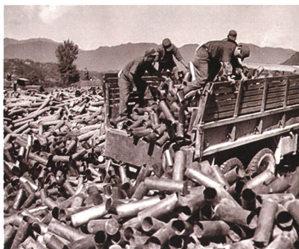
Firepower gegen Manpower – UNC-Artillerie, 25 Millionen verschossene Granaten in 22 Monaten.

Es gab aber auch offensichtliche Nutzniesser. Der damalige japanische Ministerpräsident Yoshida bezeichnete den Krieg als «Geschenk der Götter», welches Japan einen zeitlich vorgezogenen vorteilhaften Friedensvertrag mit den USA, einen wirtschaftlichen Boom und Wiederaufstieg bescherte. Auch Generalissimus Chiang Kai-shek gehörte zu den Nutzniessern. Die USA verhinderten mit der Blockade der Taiwan-Strasse die Einnahme durch die Volksrepublik. China sah sich, trotz hohen Opfern, auch auf der Gewinnerseite, konnte es sich doch durch den Krieg als weitere ernst zu nehmende dritte Macht etablieren.