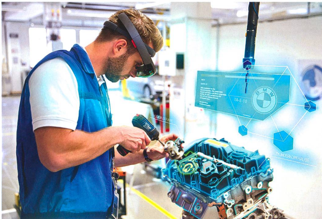
Denkbar für die Instandhaltung und in der zivilen Industrie bereits im Einsatz: realitätserweiternde Brillen bei den BMW.