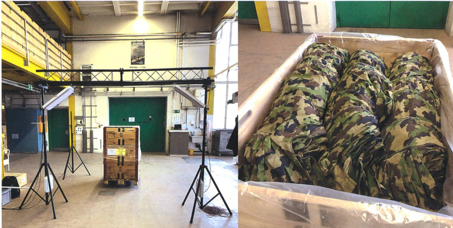
Lassen sich in einem Scannerportal innert Sekundenbruchteilen praktisch fehlerfrei erfassen: mit RFID-Transpondern ausgerüstete palettierte Textilien.