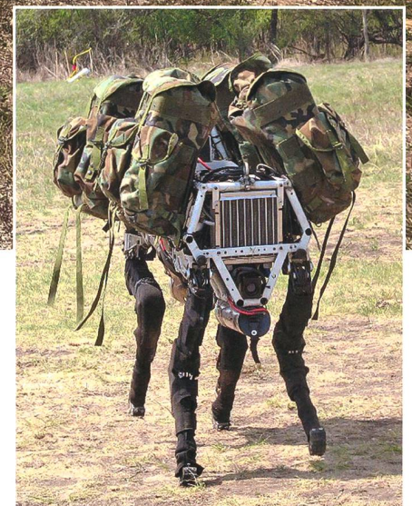
Mechanischer Lastesel «Big Dog» Boston Dynamics.

Wurde durch das «Defence Science and Technology Laboratory» (Dst) des Vereinigten Königreichs zu Testzwecken bestellt: unbemanntes Letzte-Meile-Logistikfahrzeug «VIKING» des Herstellers Horiba Mira.