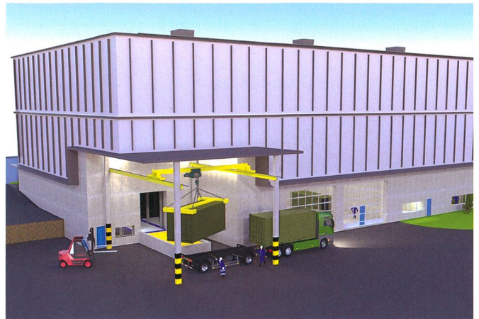
Der Containerstützpunkt Thun befindet sich bereits im Bau.