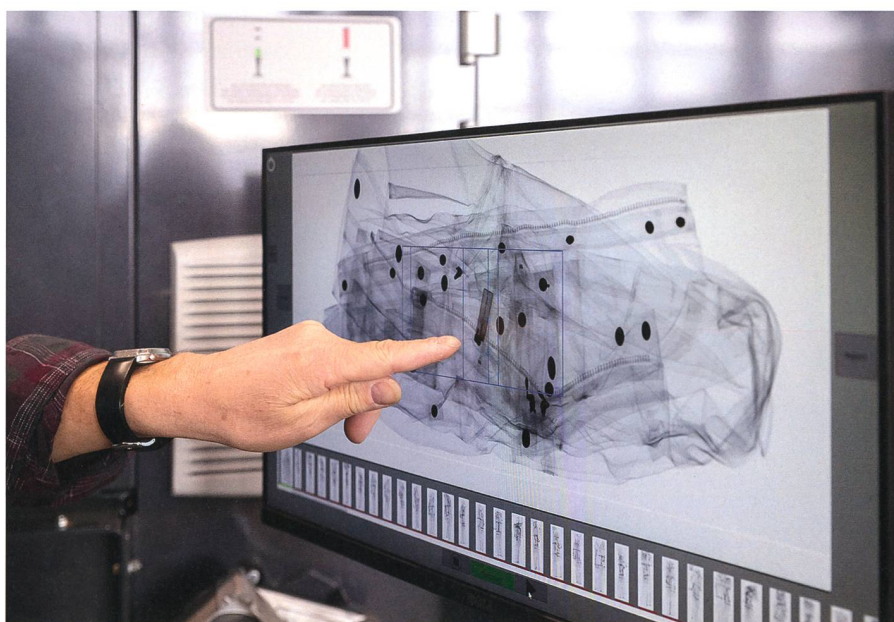
Der lernfähige Textilscanner der Waschstrasse Sursee kann sein Repertoire laufend erweitern, um weitere Fremdgegenstände zu erkennen.