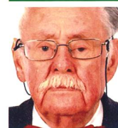
Friedrich-Wilhelm Schlomann Dr. iur utriusque D-53639 Königswinter

Anfang 1955 wurde ein Schnellboot von einem sowjetischen Schiff beschossen. In der folgenden Zeit war ein unbemerktes Eindringen in den östlichen Teil der Ostsee angesichts verstärkter sowjetischer Gegenmassnahmen kaum noch möglich. Die Einsätze mussten daher reduziert werden und wurden bis 1963 nur noch zu wichtigen spezifischen Aufträgen durchgeführt. Auch im folgenden Jahr gab es lediglich noch eine derartige Aktion. Ob sie wirklich die letzte war, scheinen die Historiker im genannten Okkupations-Museum eher anzuzweifeln. Unterlage darüber existieren zumindest in Estland nicht. Sie werden wohl für immer Geheimnisse der Operationen «Jungle» und «Rusty» bleiben. ■