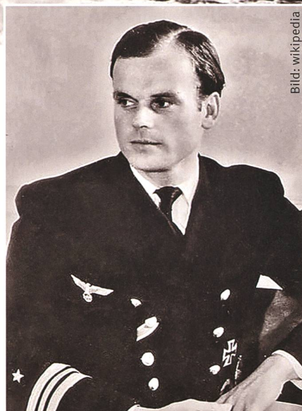
Kapitänleutnant Hans-Helmut Klose.

sätzen im Rahmen der Operation «Rusky» aktiv teilnahm, bevorzugte die Einschleusung ihrer Agenten per grossen, mit Wasserstoff gefüllten Luftballons; diese wurden in den Schnellbooten unmittelbar vor der polnischen Küste aufgefüllt. Bekannt ist die auf diese Weise erfolgte Anlandung von acht polnischen Spionen im Herbst 1952 im weiteren Hinterland von Ustka (Stolpmünde, Pommern). Ausgerüstet waren sie mit echter polnischer Zivilkleidung, Funkgeräten, Medikamenten und vielen, damals in Polen so begehrten, Schweizer Uhren (mit denen auch gerade Gehlen Spione anwarb).