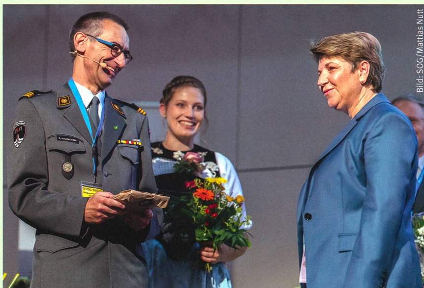
Chefin VBS und Präsident SOG.

direktor des Kantons Bern, die Grüsse der Kantonsregierung. Er schickte voraus, dass die Sicherheit von Land und Leuten nicht verhandelbar ist und zeigte auf, dass wir, mit Verteidigungsausgaben pro Jahr von etwa 0,7% des BIP, in Europa zuhinterst