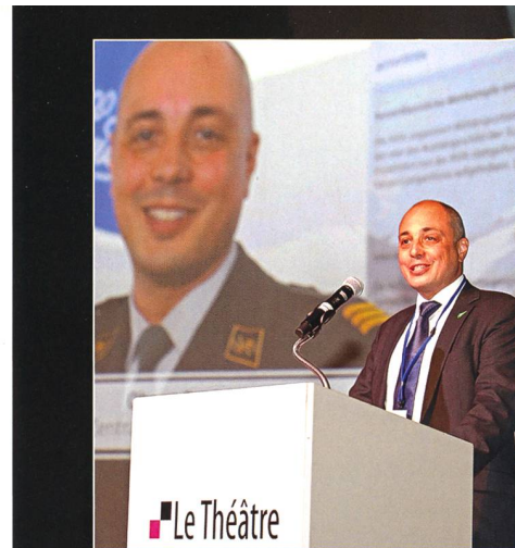
Oberst Patrick Richter, Präsident der AVIA, bei der Eröffnung.

Beginnen wir selbstkritisch mit den Befürwortern: Sie scheuten sich lange klar zu sagen, dass die Verteidigungsarmee schlicht der Vergangenheit angehört, wenn man ihre Luftwaffe nicht rechtzeitig ersetzt. War die dahinterstehende Furcht wirklich begründet, deutliche Worte könnten noch unschlüssige Zeitgenossen gewissermassen aus Trotz ins gegnerische Lager treiben? Was halten wir von der Mündigkeit des Stimmbürgers? Wenn die Scheu vor klarer Ansage berechtigt war, mag der Vorwurf zutreffen, man habe in der Vergangenheit zu häufig damit gedroht, das Scheitern dieses oder jenes einzelnen Vorhabens setze die Ar-