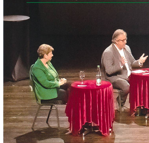
Die grosse Diskussionsrunde während eines Beitrags von NR Beat Flach.

mee als Ganzes aufs Spiel. Da es jetzt zutraf, schien das Argument verbraucht.