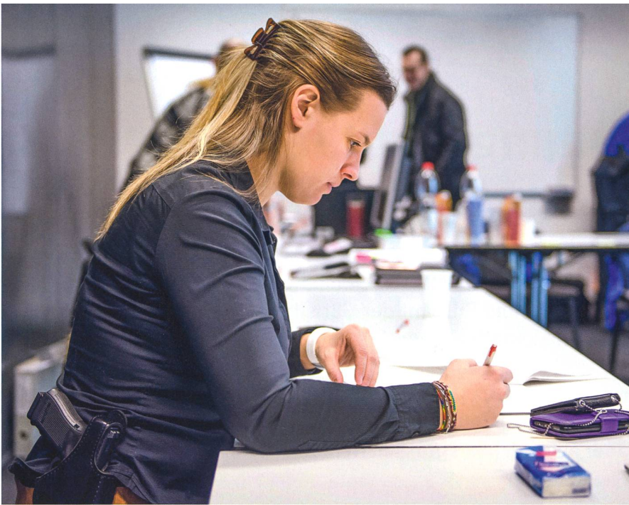
Teilnehmerin der Berufsprüfung.

korps. Nur wer besteht, darf dort die zweite Ausbildungsphase in Angriff nehmen.