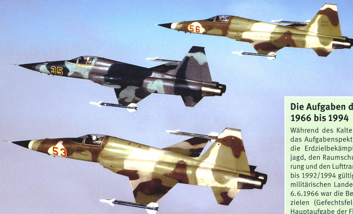
F-5E «Tiger II» der 527th TFTAS (1983).

erster Linie bei und von den Nachbarluftwaffen, der USAF, der britischen RAF, der israelischen IAF und der schwedischen Flygvapnet, gehörten seit 1965 regelmässig zum Programm der Flieger- und Fliegerabwehrtruppen. 5 Anders als die Luftwaffen der NATO-Staaten, wo die meist kriegsunerfahrenen europäischen Flugzeugbesatzungen zusammen mit ihren kampferprobten Bündnispartnern (vor allem USAF) übten, verfügte die neutrale schweizerische Flugwaffe aber nicht über