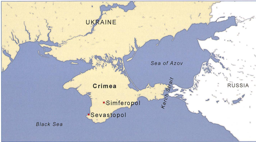
Seit 2014 besetzen russische Milizen (Spezialkräfte) die Krim.