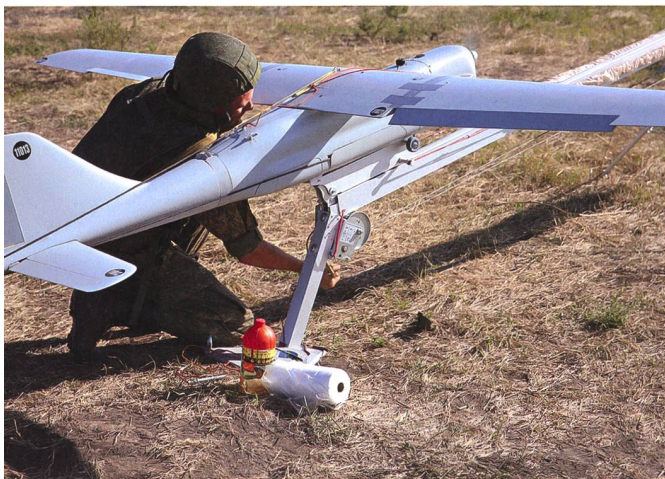
Russische Drohnen werden in Syrien und in Libyen eingesetzt.

Die innenpolitische und auch die ausenpolitische Situation Libyens ist sehr komplex, zahlreiche internationale Staaten, unter anderem die Türkei, Ägypten, Russland und die Vereinigten Arabischen Emirate üben Einfluss auf Libyen aus, dabei geht es um reiche Öl- und Gasvor-