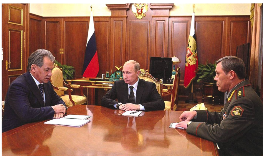
Sergej Shoigu, Wladimir Putin und General Gerasimow.

Seit sechs Jahren herrscht im Osten der Ukraine ein von Russland geschürter kriegerischer Konflikt, mit inzwischen mehr als 10 000 Toten. Doch relativ schnell schwand dieser von Russland begonnene