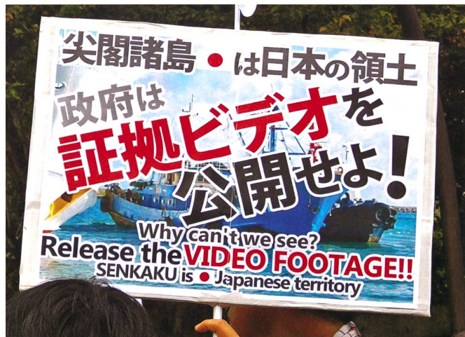
Zwischenfall bei den Senkaku-Inseln. Japaner verlangten die Veröffentlichung des Videos.

Der wichtige Wirtschaftsverband Nippon Keidanren ist bekanntlich pro China und übt stets einen starken Druck auf die Regierung aus. Der riesige Markt Chinas mag für ihn äusserst attraktiv sein. Es ist jedoch nicht weitherum bekannt, dass ausländische Unternehmen, vor allem japanische, die sich aus China zurückziehen wollen, ihr dortiges Vermögen verlieren und sogar zusätzliche Kosten zu tragen haben. Ex-Premierminister Abe war an die Pro-