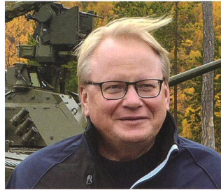
Peter Hultqvist erklärt Rüstungsbedarf.

de aufgestockt. Die Luftwaffe erhält ein weiteres Geschwader, ebenso einen neuen Grenzjägerverband in Nordschweden. Es gibt insgesamt mehr