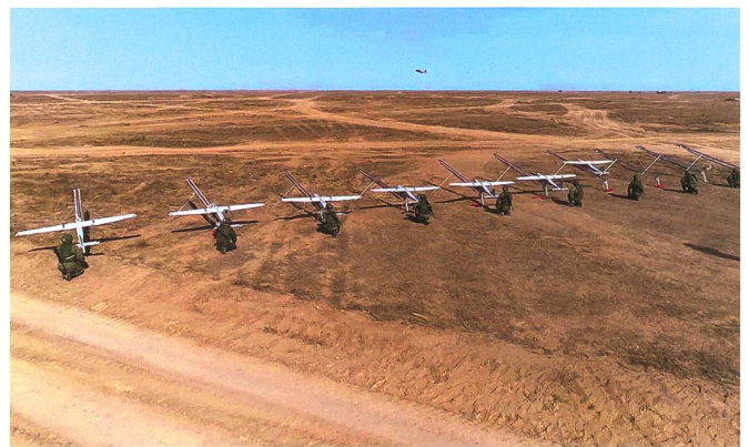
UAV-Batterie ist startklar.