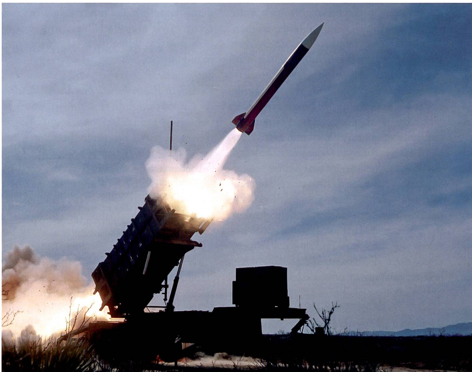
Abschuss einer Patriot-Lenkwaaffe.

Neben seiner Leistungsfähigkeit im Abwehrkampf gegen eine breite Palette von Bedrohungen aus der Luft, überzeugt das Patriot System mit einem kostengünstigen Betrieb. Die Nutzergemeinschaft des Patriot Systems wacht sorgfältig darüber, dass das System auf dem neuesten Stand bleibt. Dazu wurde ein gemeinsamer Finanzierungstopf geschaffen, an dem sich jede Nutzernation basierend auf der Anzahl Feueereinheiten anteilmässig beteiligt. Die Schweiz würde ebenfalls von der Nutzergemeinschaft profitieren. Falls unsere Armee zukünftig Patriot Feueereinheiten betreibt, müsste sie folglich nur einen sehr geringen Anteil an die Weiterentwicklungs- und Unterhalts-