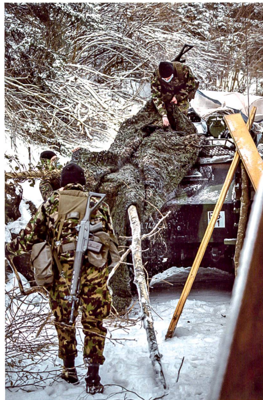
Tarnung eines «Eagle».

standhaltens. Eine bekannte Herausforderung stellte auch dieses Jahr die extrem tiefen Personalbestände dar. So mussten die Aufklärungs-Logistik- und Stabs-Kompanie zusammengelegt werden und wie bereits in den Vorjahren wurde eine Aufklä-