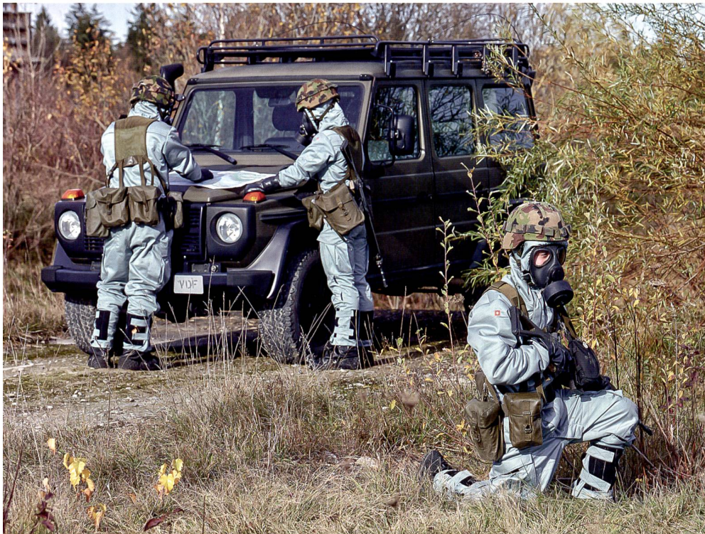
Neue individuelle ABC-Schutzausrüstung.

ausbildung, Erhöhung der Bereitschaft, Stärkung der regionalen Verankerung und vollständige Ausrüstung. Gerade dieser letztgenannte Pfeiler wankt praktisch seit Anbeginn bedenklich: Aus Kostengründen können wichtige Systeme nicht vollständig beschafft werden. Die Beschaffungs-Bugwelle wegen Bestandeslücken