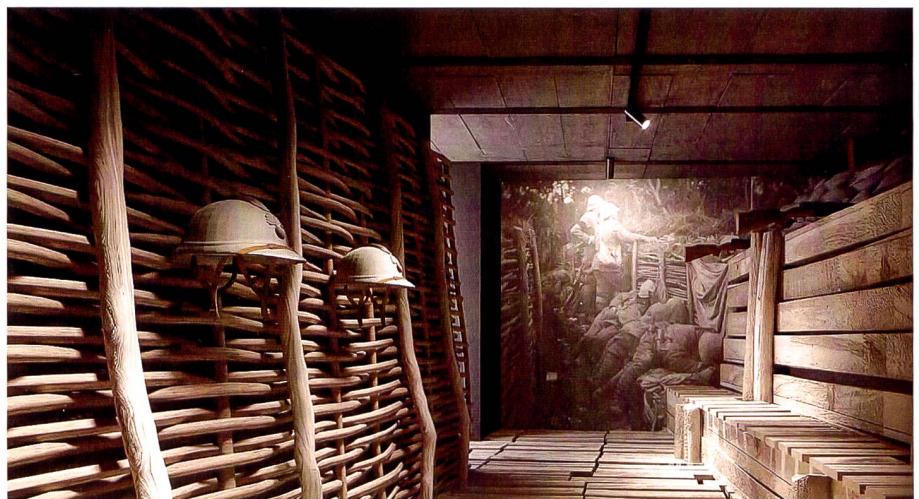
Rekonstruktion eines Schützengrabens 1914 bis 1918.