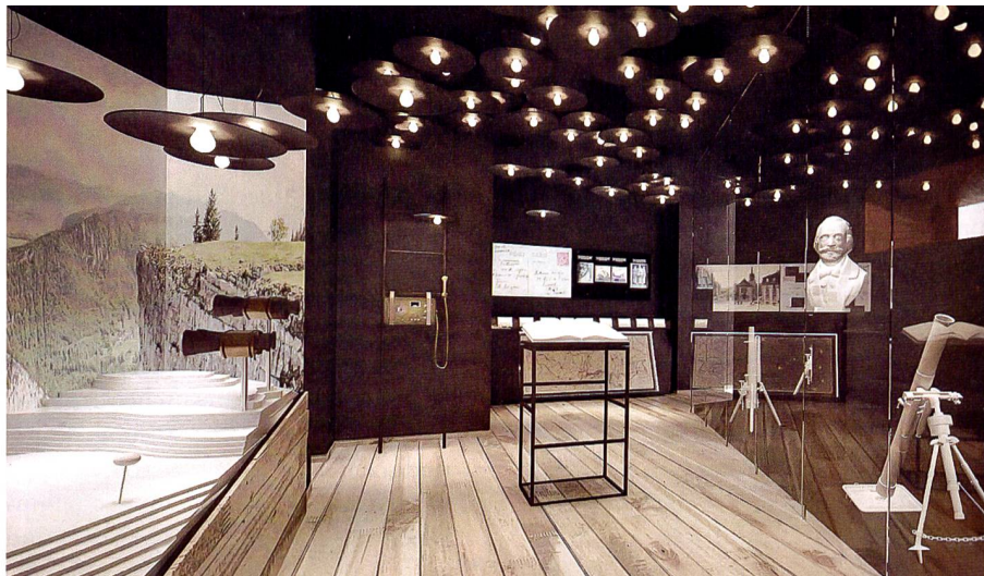
Die Ecke der in der Tiefe gestaffelten Infanterieforts und der Beobachtungsposten.

schiedene Aspekte mittels Touchscreens betrachten (mehrere Ansichten sind simultan möglich).