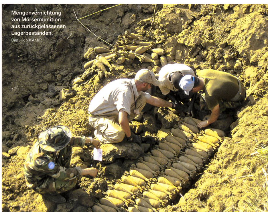
Mengenvernichtung von Mörsermunition aus zurückgelassenen Lagerbeständen.