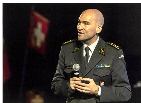
▲▲ KKdt Thomas Süssli, Chef der Armee.