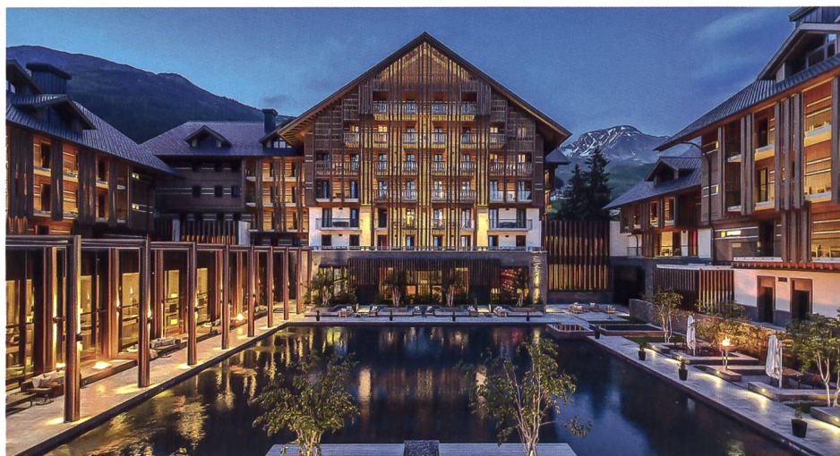
Strategischer Wandel in Andermatt.

Diese enge Zusammenarbeit zwischen zivilen und militärischen Stellen äussert sich auch in der Wahl der Durchführungsorte: Eines der drei Module findet in Chur (FHGR), ein zweites in Birmensdorf (MILAK) statt. Das dritte Modul ist an alternierenden Standorten angedacht, je nach zu behandelndem «Living Case» (Anschauungsbeispiel). Im ersten Kursjahr 2022 wurde aus naheliegenden Gründen Andermatt gewählt: Dort kann man einen schon fast einzigartigen touristischen Change-Prozess gewissermassen Live miterleben, wo sich ein eher verschlafener, ehemaliger Trup-