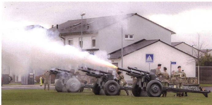
Zeremonie zur Reaktivierung in Wiesbaden.

Die US Army will ihre Feuerführung und damit verbundene Koordination in Europa wieder hochfahren. Dazu wurde das 56. Artilleriekommando am Standort Mainz-Kastel in Deutschland reaktiviert. Kommandant des Verbandes ist Generalmajor Stephen J. Maranian. Dazu meinte der Zweisternegeneral anlässlich der Feierlichkeiten anfangs November, «die Reaktivierung des 56. Artilleriekommandos wird die US Army Europe and Africa mit bedeutenden Fähigkeiten für Multi-Domain-Operationen ausstatten». Seine Einheit steht in langer Tradition, wurde während des Zweiten Weltkriegs gegründet,