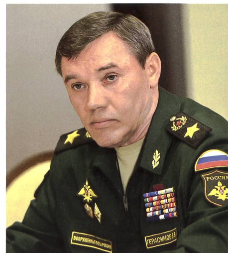
► Der russische General Waleri Gerassimow.