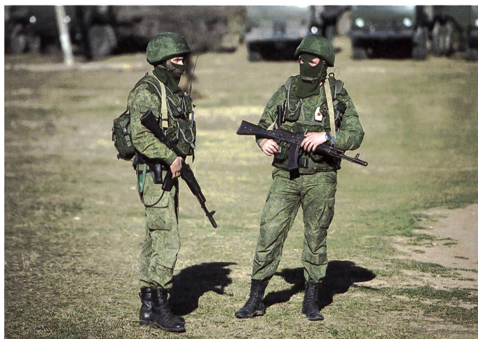
▲ Die «grünen Männchen» – Soldaten ohne Hoheitsabzeichen – waren bei Russlands Annektierung der Krim omnipräsent.