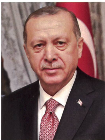
▲ Der türkische Präsident Recep Erdogan.

Die Aussen- und Sicherheitspolitik der Türkei sorgt bei zahlreichen Politikern von EU- und NATO-Mitgliedsstaaten immer wieder für «Erstaunen» beziehungsweise «Empörung». Da die türkische Regierung als realpolitischer Kenner der EU bewertet werden kann, ist davon auszugehen, dass solche Formen von Aussen- und Sicherheitspolitik auch mittelfristig immer wieder von der Türkei angewendet werden. ■