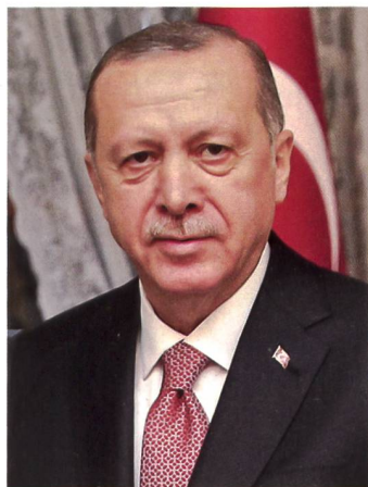
▲ Der türkische Präsident Recep Erdogan.

Mitte Oktober 2021, hatte sich die damalige deutsche Bundeskanzlerin Angela Merkel bei ihrem Treffen mit dem türkischen Präsidenten Erdogan für eine Fortführung des Flüchtlingsabkommens zwischen der EU und der Türkei ausgesprochen. Es sei wichtig, dass die EU die Türkei weiterhin «bei der Bekämpfung der illegalen Mi-