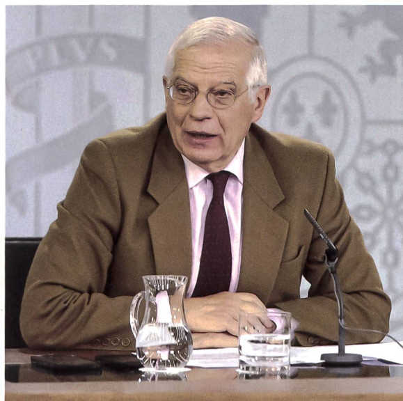
► Der EU-Aussenbeauftragte Josep Borrell.