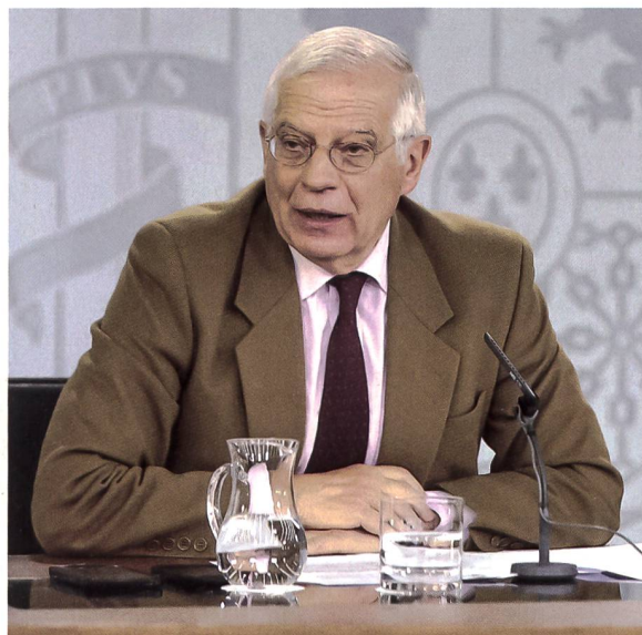
► Der EU-Aussenbeauftragte Josep Borrell.