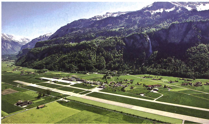
Für den Militärflugplatz Meiringen sind Berechnungen für die Lärmbelastung durch den F-35 durchgeführt worden.