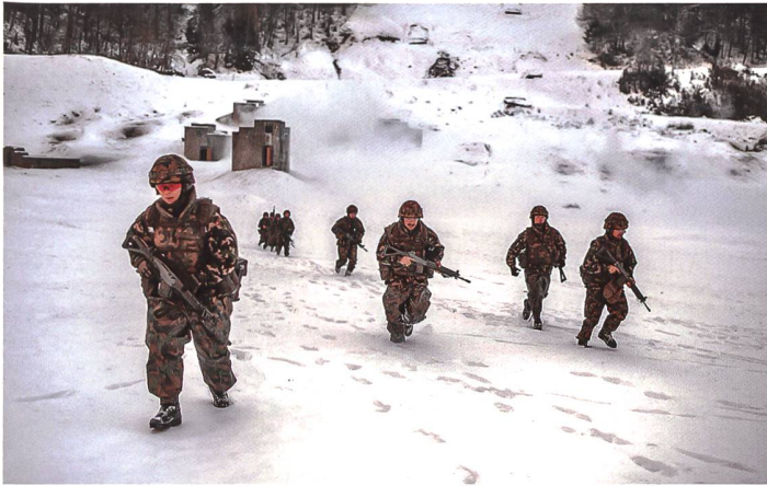
Beim Häuserkampf zeigten sich einige Leistungslücken.

selbst in Isolation zu begeben). Trotzdem kam es im Verlauf des Kurses zu mehreren Ausbrüchen, die Einsatzbereitschaft konnte aber stets sichergestellt werden.