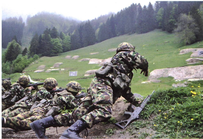
Gefechtsschiessen der Aufkl Kp 5/1 auf dem Schiessplatz Cholloch.

Ausgehend vom Programmteil des Sachplans Militär wird der Objektteil mit den spezifischen Festlegungen für die einzelnen militärischen Standorte serienweise überarbeitet. Die zweite Serie umfasst die Objektblätter der Logistikstandorte Bronschhofen (SG), Eschenbach (SG), Mels (SG) und Rotkreuz (ZG), der Schiessplätze Obertoggenburg Nord (SG) und Ricken-Cholloch (SG) sowie der Übungsplätze Full-Reuenthal (AG) und Linthebene (SG). Für diese Standorte legen die Objektblätter insbesondere den Rahmen für die militärische