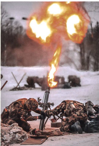
Bei den Gefechtsschiessen kam auch der Minenwerfer zum Einsatz.