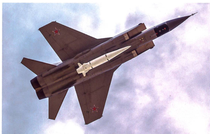
◀ Dieses russische Kampfflugzeug MiG-31K ist mit der Lenkwaffe Kinzhal bestückt.