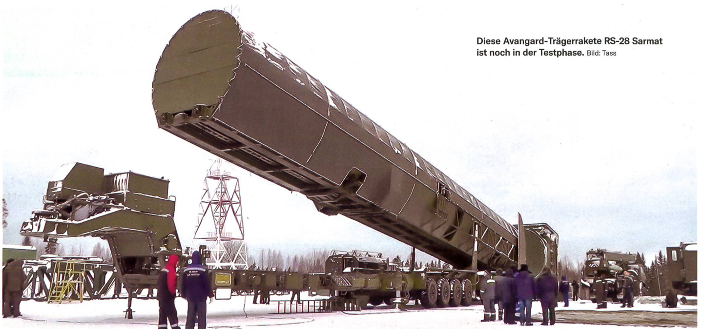
Diese Avangard-Trägerrakete RS-28 Sarmat ist noch in der Testphase.

Entlang der Grenze, unter anderem auch auf weissrussischem Gebiet, stehen mindestens drei Raketenbrigaden, die mit rund 40 mobilen Abschussystemen Ziele in der Ukraine bekämpfen. Zudem sind aus dem Schwarzen Meer seegestützte Marschflugkörper vom Typ Kalibr (SS-N-30) eingesetzt worden. Mit diesem konventionellen Raketen- und Lenkwaffenbeschuss wurde zu Beginn der Offensive die Infrastruktur der uk-