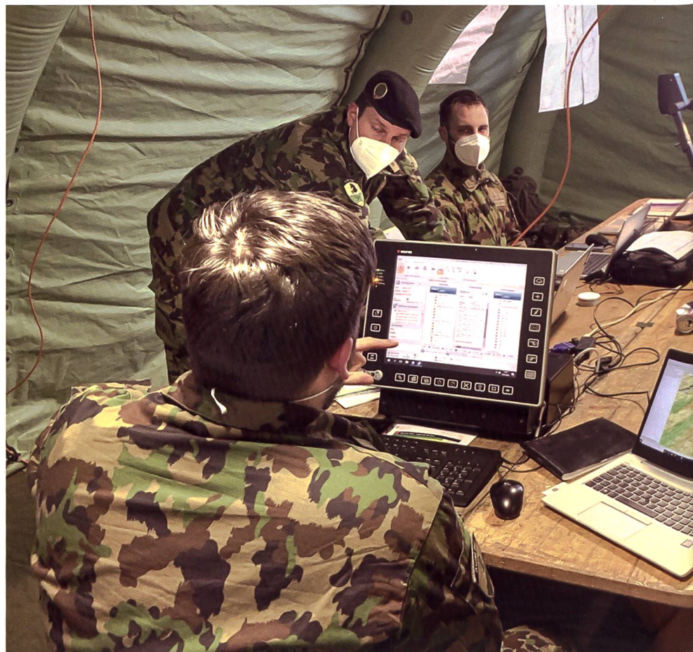
► Die Stäbe der Truppenkörper der Mech Br 4 trainieren die Führungstätigkeit über mehrere Tage im Massstab 1:1.

Im Informationsraum herrscht der «Krieg der Bilder und Worte»: Propaganda und Desinformation im Informationsraum werden über die neuen Kommunikationskanäle (digitale Portale, soziale Medien) noch stärker als in der Vergangenheit Teil der aktiven Konfliktführung. Die Eskalation einer