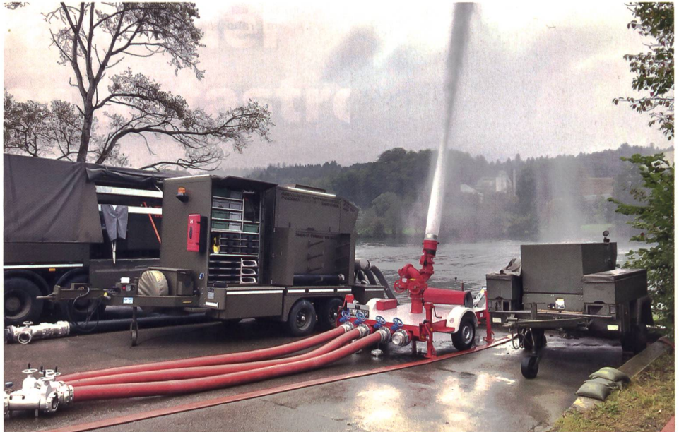
Die Rettungstruppen verfügen nun über Pumpen und Wasserwerfer der neuen Generation.

stützen sie andere Truppengattungen bei Einsatzvorbereitungen und während des Einsatzes. (TF 17, Ziffer 4014)