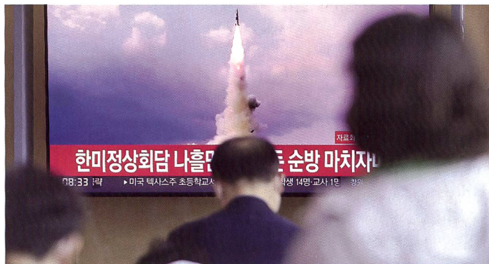
Interkontinental-Rakete Nordkoreas im südkoreanischen Fernsehen.

anzuheizen. US-Präsident Joe Biden bekräftigte aber auch, dass er an der Politik der «strategischen Zweideutigkeit» in der Taiwan-Frage festhalte. Dieser seit Langem verfolgte Kurs bedeutet, dass die Vereinigten Staaten zwar Taiwan Unterstützung beim Aufbau von dessen Verteidigungsfähigkeiten zusichern, aber nicht ausdrücklich versprechen, der Insel im Falle eines Krieges zu Hilfe zu kommen. Sc