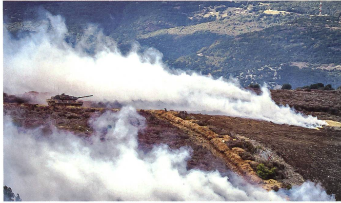
Griechischer Leopard im Trainingseinsatz.

Athen benötigt schweres Gerät. Deshalb sollen 183 Kampfpanzer Leopard 2 A4 auf den Standard A7 modernisiert werden, mit der Option auf den Ausbau mit Trophy, einem abstandsaktiven Schutzsystem. Dazu kommen 190 Leopard 1 A5 mit neuer Zieloptik. Die Panzer alleine kosten etwa 1,3 Milliarden Euro. Die Trophy-Zielzuweisung macht weitere 600 Millionen Euro aus. Den Upgrade würde das deutsche Rüstungsunternehmen KMW übernehmen, das auch die vom israelischen Hersteller Rafael stammenden Trophy-Einbauten übernimmt.