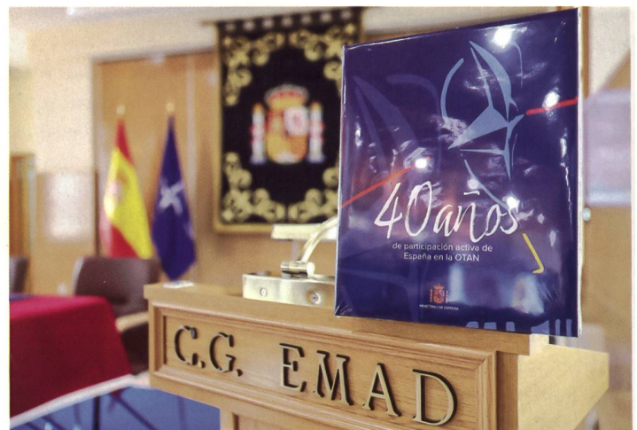
Präsentation der Festschrift zum Jubiläum.

Wollte Spanien zuerst lediglich im Rahmen der EU-Bemühungen der Ukraine mit humanitären Gütern und militärischem Material helfen, so wurde unterdessen bekannt, dass das Königreich auch Luftabwehrraketen sowie gebrauchte Kampfpanzer Leopard 2, die es aus alten Bundeswehrbeständen in Deutschland kaufte, in die Ukraine schicken will. Gerade die Hilfeleistung mittels modernen Panzern wäre gesamteuropäisch ein «Game-Changer». Gleichzeitig hat das Land zum zweiten Mal infolge seiner Teilnahme an der internationalen Militärübung «African Lion» (unter