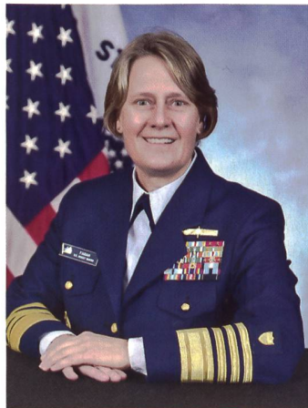
Admiral Linda Fagan.