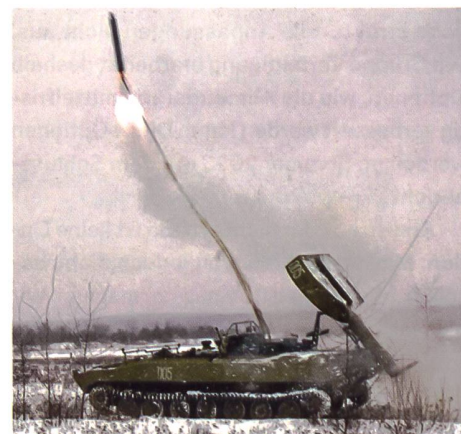
▲ Minenräumsystem UR-77 beim Abschuss explosiver Räum-schlangen.