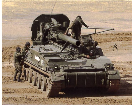
Ein schwerer Selbstfahrminenwerfer 2S4M im Einsatz.

Das auf einem Geländelastwagen basierende Werfersystem mit 50 Abschussrohren vom Kaliber 122 mm verschießt Raketen, die mit streubaren Antipersonen- oder Panzerabwehrminen beladen sind. Bisher eingesetzt wurden Personenminen vom Typ POM-3 und Panzerabwehrminen PTM-4.