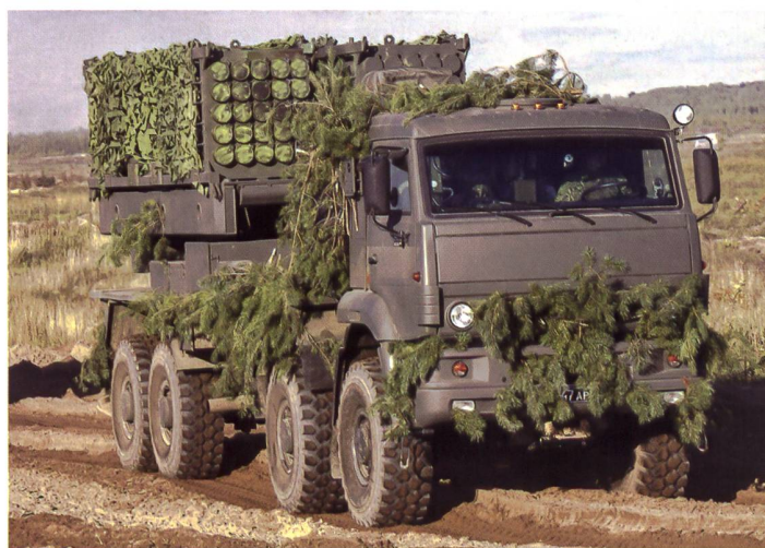
◀ Fernverminnungssystem ISDM kann grossflächig Personen- und Panzerabwehrminen einsetzen.