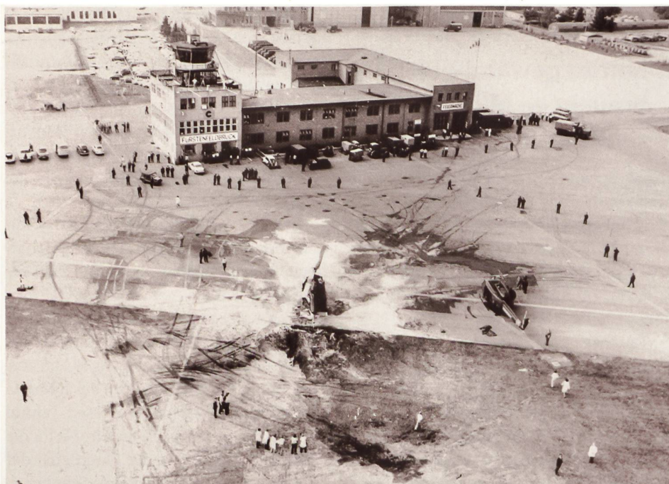
◀ 5. September 1972: Der Versuch bayerischer Polizisten, die israelischen Geiseln zu befreien, scheiterte in Fürstenfeldbruck.

Mogadischu brachte der GSG 9 und ihrem Kommandeur weltweite Anerkennung. Die folgenden Einsätze gegen Terroristen und Schwerstkriminelle blieben der Öffentlichkeit meist verborgen. Für mediales Aufsehen sorgte der Zugriff in Bad Kleinen, bei dem im Jahr 1993 ein RAF-Terrorist und ein GSG-9-Beamter ums Leben ka-