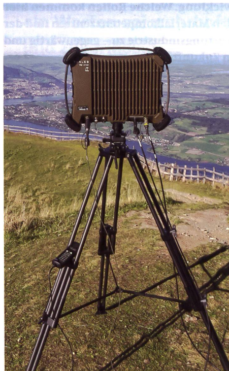
22-09 TRC4100, vollständig bei Thales Suisse entwickeltes leistungsfähiges Breitbandkommunikationssystem.

Schweiz lokal zur Verfügung stehen und die Sicherheit in der Schweiz gestärkt wird. Aus meiner Sicht eine gute Basis; man muss jedoch noch viel mehr von diesen neuen Möglichkeiten zur Stärkung der schweizerischen STIB Gebrauch machen.