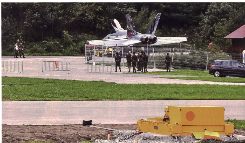
▲ Während der Übung STABANTE war es möglich, unbemerkt zum Flugfeld St. Stephan zu gelangen.

Nach insgesamt zehn Übungen bei Münsingen, Flums und Alpnach fand im Jahr 1991 die letzte Übung dieser Art im Tessin statt. Beim Bau der Autobahn Bern–Lausanne Ende der 1990er-Jahre wurde der A1-