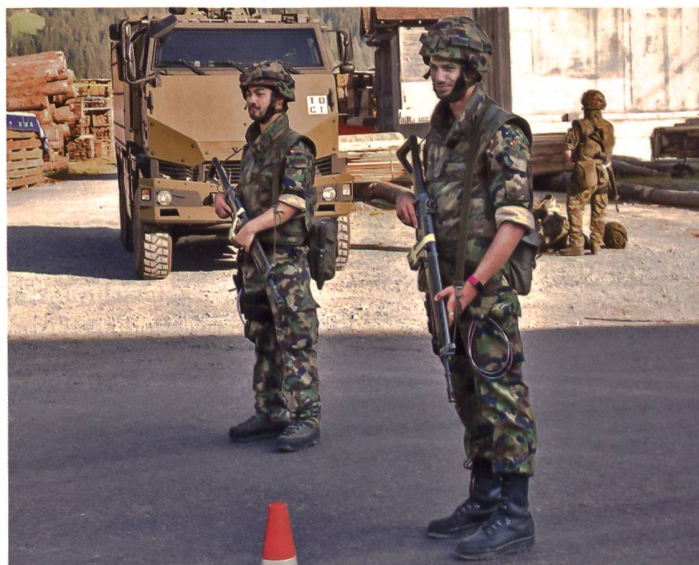
► Der Flugplatz St. Stephan wird rundum abgesichert.