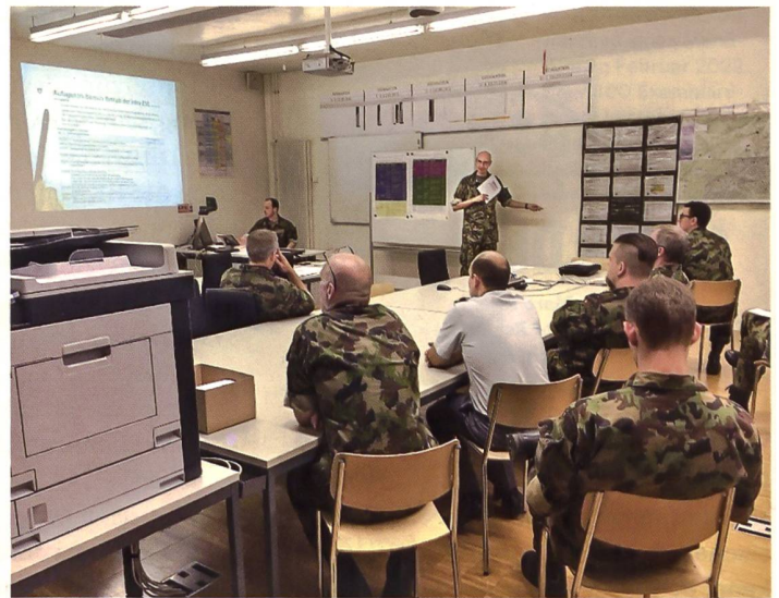
Rapport im Führungslehrgang Grosser Verband 1. Teil.

konzeptes. Im GLG II werden während zwei Tagen die notwendigen Zusammenhänge für eine Luftwaffenoperationsplanung vermittelt. Im Rahmen einer massgeschneiderten Aktionsplanung Luft erarbeiten die Lehrgangsteilnehmer Teile der Beurteilung der Lage. Schliesslich erarbeiten sie die gegnerischen Lageentwicklungsmöglichkeiten und Varianten für die eigenen Luftwaffenoperationen.