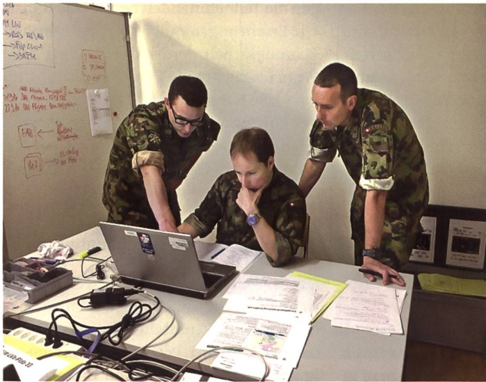
Stabsarbeit im Führungslehrgang Grosser Verband 2. Teil («Kombilehrgang»).