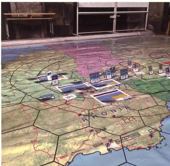
◀ Wargame im Führungslehrgang Grosser Verband 2. Teil («Kombilehrgang»).

In den kommenden Jahren werden die Anforderungen an die Ausbildungsinhalte der HKA aus der Operationssphäre Luft substantiell zunehmen. Die grosse Herausforderung der Armee allgemein, und der Luftwaffe im