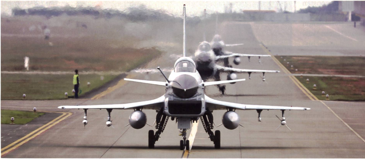
◀ X J-10B der PLAAF während eines Manövers im Februar 2022. Über 400 Exemplare dieser leistungsstarken Eigenentwicklung befinden sich im Inventar der PLAAF.