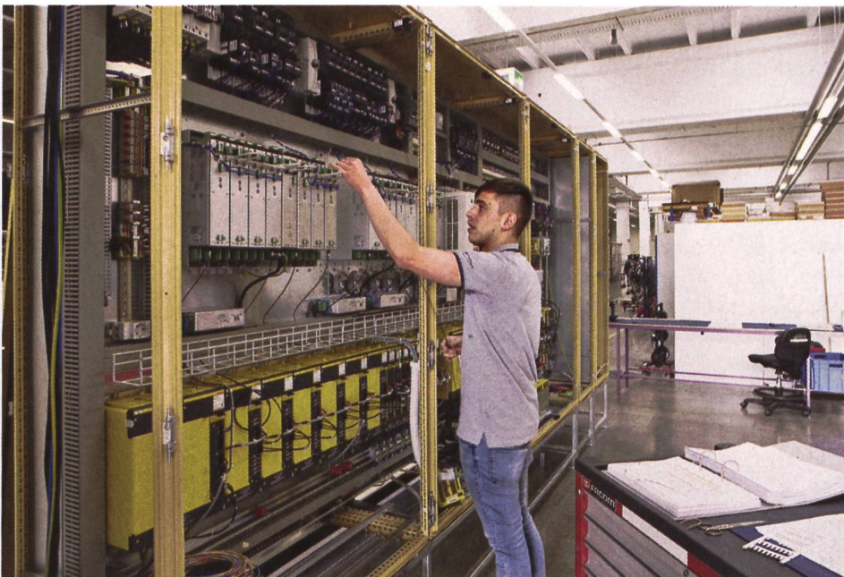
Fertigung von industriellen Schaltschrank.

ist in allen westlichen Staaten dasselbe. Uns betrifft dies auf unserer Stufe in der Lieferkette weniger stark, da wir erst in einer späteren Phase der Projektrealisation zum Zuge kommen; aber unsere Kunden leiden unter dieser Diskrepanz, wie auch die Planungsstellen der Armeen.