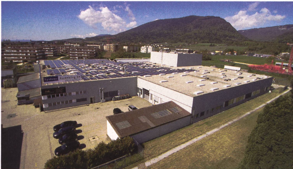
Der Firmensitz in Boudry (NE).