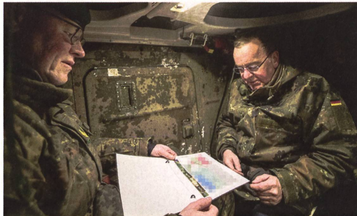
Der deutsche Verteidigungsminister Boris Pistorius lässt sich in die Übungslage einweisen.

land sind Teil der von Berlin bereitgehaltenen Kampfbrigade zur Verteidigung des Baltikums, die Bundeskanzler Olaf Scholz im Juni 2022 dem litauischen Präsidenten Nauseda versprochen hatte und seit Herbst 2022 im Land präsent ist. Während man in Vilnius aber davon ausgeht, dass die Taskforce ihren permanenten Standort in Zukunft im Rotationsprinzip in Litauen haben wird, ist man in Deutschland derzeit der Meinung, eine innert zehn Tagen im Bedarfsfall verlegbare kampfbereite Brigade vorzuhalten. Einige der Gründe dafür: In Litauen fehlt die geeignete Infrastruktur und die deutsche Bundeswehr kämpft vorerst noch mit Material- und Ausrüstungsproblemen. Laut Berichten gibt es zudem Probleme mit den modernsten Leopard 2 A7V, von welchen 30 der insgesamt 44 für die NATO-Verteidigung bereitgestellt werden müssen. Anfang Februar waren davon lediglich 20 einsatzbereit gewesen. Für Pistorius kein Grundsatzproblem, auch wenn das Hin- und Herschieben von Ausrüstung zwischen den Einsatzverbänden mittlerweile zur Usanz gehört. «Wir hatten einen Stau bei der Wartung und Instandsetzung und der wird jetzt aufgelöst», so der Verteidigungsminister. pk