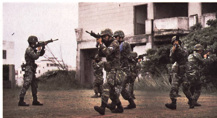
Streitkräfte Taiwans üben den Kampf in überbautem Gebiet.

Die Vereinigten Staaten verstärken die militärische und politische Unterstützung für Taiwan. Wie das Pentagon anfangs März mitteilte, genehmigte das State Department mögliche Rüstungslieferungen im Wert von 619 Millionen Dollar, darunter Raketen für F-16-Kampfflugzeuge. «Der vorgeschlagene Verkauf wird die Fähigkeit des Empfängers erhöhen, seinen Luftraum zu verteidigen, ebenso wie die regionale Sicherheit und die Interoperabilität mit den Vereinigten Staaten», heisst es in der Mitteilung. Die beteiligten Rüstungskonzerne Lockheed Martin und Raytheon Technologies hatte China im Februar auf seine Sanktionsliste gesetzt. In den vergangenen Tagen war zudem bekannt ge-