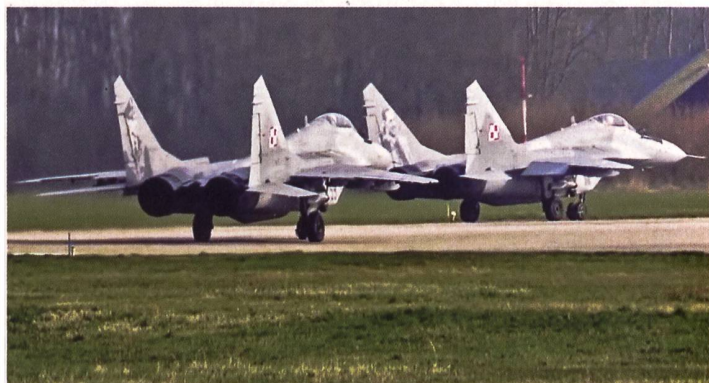
Polnische Mig-29 erhalten bald ukrainische Hoheitszeichen.

tertreffen am 8. März in Schweden gefällt. Die zehn slowakischen Maschinen aus der Lieferung wurden Ende letztes Jahr ausser Dienst gestellt. Wie schnell die Flugzeuge geliefert werden, wurde nicht thematisiert. Polens Präsident Andrei Duda zeigte deshalb die grundsätzliche Bereitschaft seines Landes, auch die letzten noch vorhandenen 30 Flugzeuge, die teilweise noch aus alten DDR-Beständen stammen, abzugeben. Diesem gemeinsamen Ver-