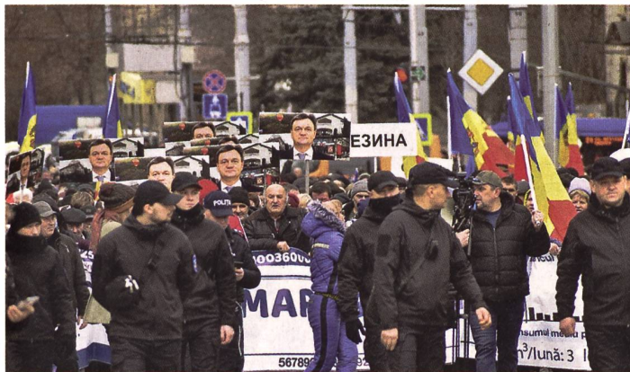
Russische TikTok-Revolution in Chisinau?

im November 2022 dürfte dieses Unterfangen jedoch vom Tisch sein. Weil der Krieg die russischen Streitkräfte zudem über das erwartete Mass strapaziert, scheinen die Ambitionen, aus Transnistrien heraus eine weitere Front gegen die Ukraine oder gar einen Krieg gegen Moldawien vom Zaun zu brechen, minimal. Für die abtrünnige Republik wird das nun zum Existenzproblem. Je weniger Unterstützung aus Moskau zu erwarten ist, desto grösser bewertet die transnistrische Regierung die Möglichkeit für eine grössere Aktion aus Moldawien respektive der Ukraine. Nur, diese Erzählung basiert auf der von Moskau gesteuerten staatlichen Propaganda. Es wird dabei behauptet, dass die moldawische Präsidentin Maia Sandu zusammen mit dem ukrainischen Präsidenten Wolodimir Selenskyj, paktiert, um auf diese Weise gemeinsam gegen die Separatisten