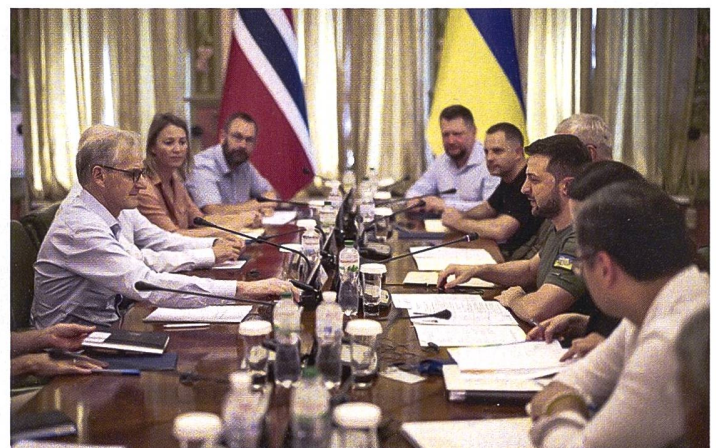
Gipfeltreffen zwischen dem norwegischen Premier mit dem ukrainischen Präsidenten.

Die Bevölkerung steht klar hinter diesen Bestrebungen. Erst Ende Mai sprach sich eine Mehrheit in einer vom staatlichen