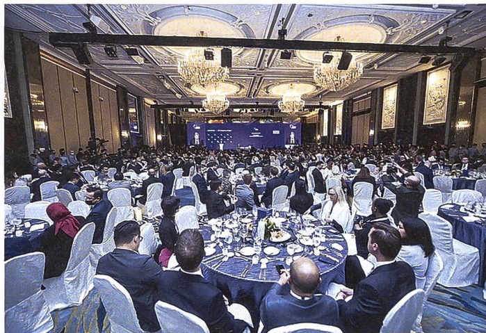
Shangri-La-Dialog 2023.

kurz miteinander und schüttelten sich beim Eröffnungssessen des Verteidigungsgipfels Shangri-La-Dialog die Hände. Das Gespräch blieb jedoch hinter den Hoffnungen des Pentagons auf einen substanzielleren Austausch zurück.