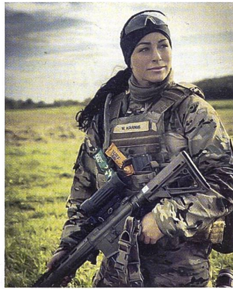
Die dänische Armee setzt sich zu einem guten Teil aus Freiwilligen zusammen.

Die NATO fordert von ihren Mitgliedern schon seit 2014, die Zwei-Prozent-BIP-Regel umzusetzen. Während vor allem baltische und südosteuropäische Länder aufgrund der Relation zu deren gesamten BIP bereits mit kleinen, aber teils dennoch feinen Rüstungsvorhaben immer wieder für Aufsehen sorgten, wagte sich das Königreich Dänemark in bisher unerreichte Beschaffungssphären vor. Obwohl Kleinstaat, hat das Land dennoch eine relativ grosse territoriale Verantwortung. Sowohl die Faröer Inseln als auch Grönland unterliegen dem Schutzmandat aus Kopenhagen. Mit etwa 9000 Berufssoldaten und einer Reserve im Umfang von 20 000 Wehrpflichtigen und Freiwilligen der Hjemmeværet (Heimwehr) ist das Land aber vollumfänglich auf die Integration in die NATO-Sicherheitsarchitektur angewiesen. In voller