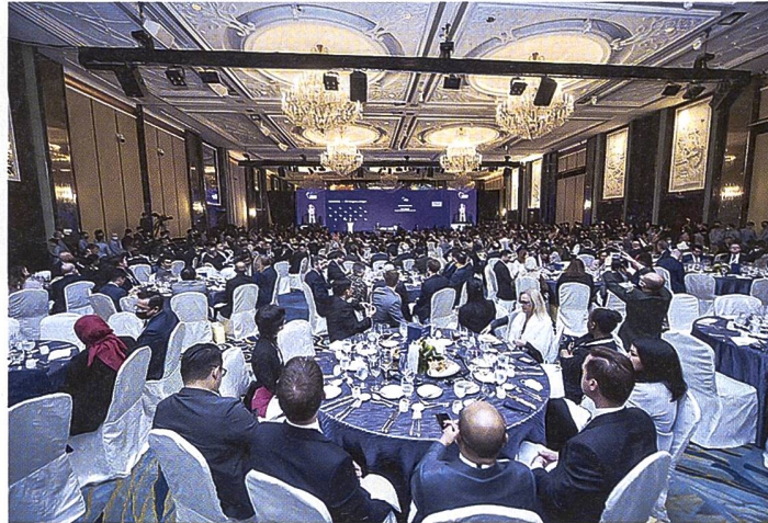
Shangri-La-Dialog 2023.

kurz miteinander und schüttelten sich beim Eröffnungssessen des Verteidigungsgipfels Shangri-La-Dialog die Hände. Das Gespräch blieb jedoch hinter den Hoffnungen des Pentagons auf einen substanzielleren Austausch zurück.