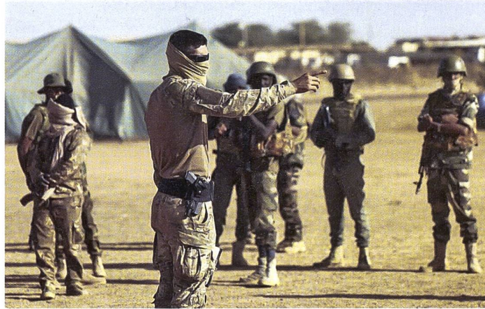
Von nun an zeigt Wagner den Weg.

Der UN-Sicherheitsrat hat Ende Juni einstimmig beschlossen, das Mandat der UN-Mission in Mali zu beenden und eine Rückzugsresolution zu verabschieden. Diese Entscheidung markiert das Ende einer neunjährigen Friedensmission in dem von Konflikten geplagten westafrikanischen Land. Die Resolution wurde nach der von der malischen Regierung geäußerten Bitte um den Abzug verabschiedet. Der malische Außenminister Abdoulaye Diop erklärte im Vorfeld: «Es ist an der Zeit, dass Mali die volle Verantwortung für seine Sicherheit übernimmt und den Friedensprozess selbstständig vorantreibt.» Seine Regierung hat dabei betont, dass sie in der Lage sei, die Sicherheit im Land selbst zu gewährleisten und den Schutz der Zivilbevöl-