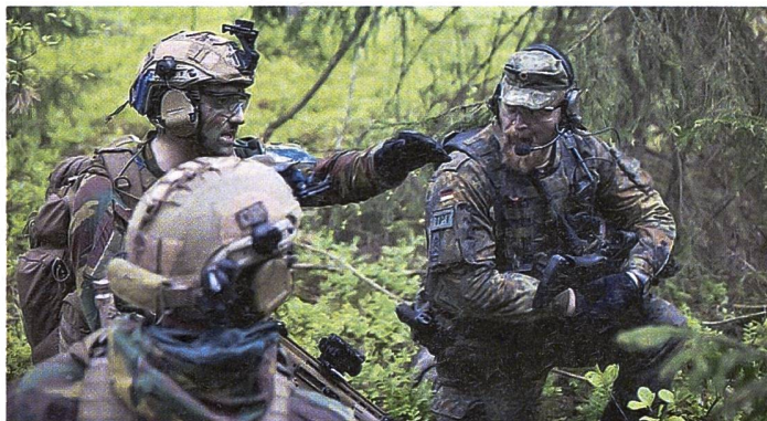
Enhanced Forward Presence: deutsche und litauische Soldaten trainieren gemeinsam.

Im Juni erklärte der deutsche Verteidigungsminister Boris Pistorius, eine Kampfbrigade mit 4000 Soldaten dauerhaft in Litauen zu stationieren. Damit will Deutschland eine starke militärische Präsenz im Rahmen der Operation «Enhanced Forward Presence» an der NATO-Ostflanke gewährleisten. Diese anlässlich des Staatsbesuchs bei seinem litauischen Homologen Arvydas Anusauskas in der Hauptstadt Vilnius gemachte Ankündigung wollen einige Beobachter als überraschend und unerwartet für die Bundeswehr interpretieren. In Wahrheit geht sie jedoch auf die vor über einem Jahr bei seinem Baltikums-