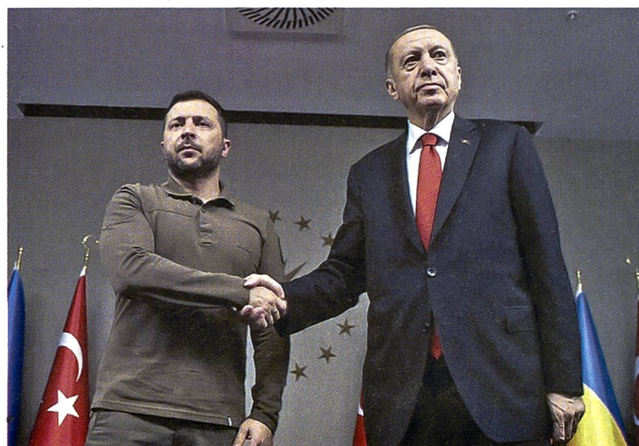
Selenski und Erdogan: Zwei Präsidenten sind sich einig.

ner Legende. Ebenfalls machte man sich für den Gefangenen-austausch stark und vermittelte insbesondere im Zusammenhang mit den Kämpfern der ukrainischen Asow-Brigade, deren kommandierende Offiziere Präsident Selenski nach seinem Besuch mit in die Heimat brachte. Unterdessen kündigte die Türkei sogar an, seine