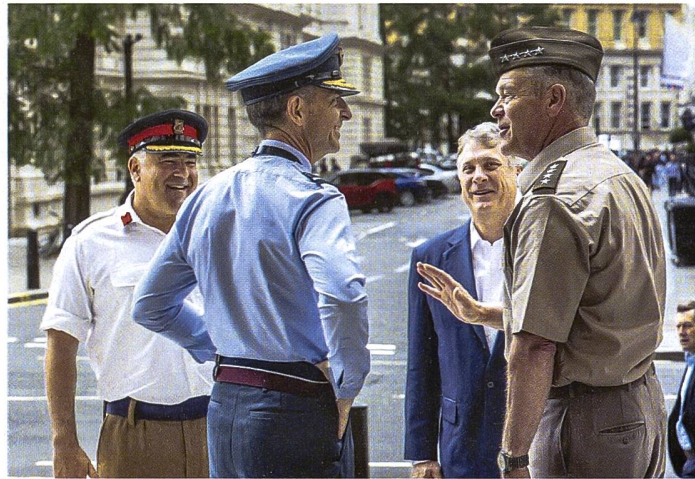
US-General Dickinson bei seinem Besuch in London.

«Alles, was wir seit Beginn des Weltraumzeitalters gemacht haben, haben wir falsch gemacht.» Klare Worte des stellvertretenden Kommandanten des US Spacecom, Generalleutnant John E. Shaw. Es brauche nun eine grundlegende doktrinale Anpassung hin zu dynamischen Weltraumoperationen, so der Dreisternegeneral. Er bezieht sich vor allem auf die Kompetenzverteilung innerhalb der Streitkräfte. Ursprünglich für sämtliche Operationen oberhalb 100 Kilometer des Meeresspiegels im Jahr 2019 gegründet, konkurriert das Spacecom (verantwortlich für den waffengattungsübergreifenden Einsatz von militärischen Weltraummitteln) unterdessen mit der später aufgestellten Space Force (zuständig für Organisation, Training und Ausrüstung der von den verschiedenen Teilstreitkräften zuzuteilenden Weltraumexperten). Shaw betont, dass es derzeit nur eine Leitlinie, zusammengefasst unter «Space Operations», gäbe. Diese sei ausbaubar, denn das Ziel müsse sein, «am Ende über mehrere Grundlagendokumen-