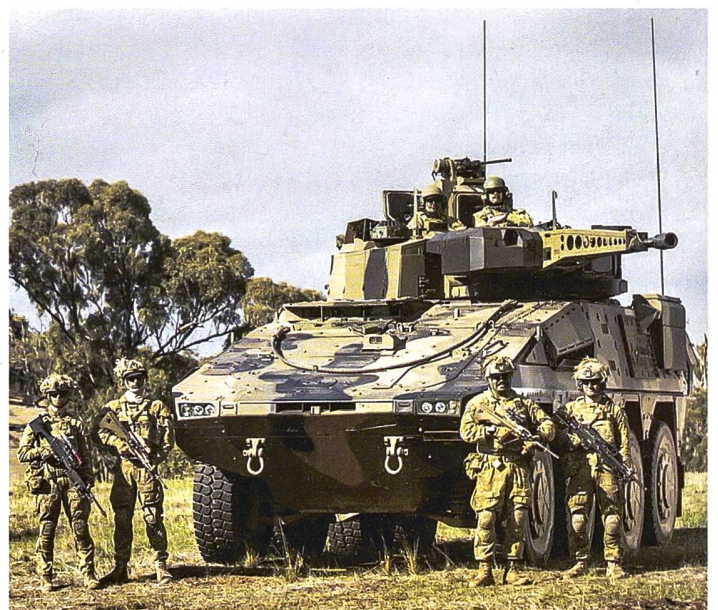
Australiens Boxer in der Aufklärungsausführung.

Staatsbesuch des australischen Premiers bei seinem Amtskollegen Olaf Scholz in Berlin Anfang Juli verbrieft. Dort wurde