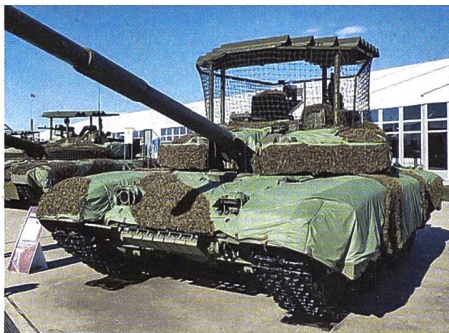
Russischer Kampfpanzer T-90M mit Drohenschutzgitter und mehrschichtigem Schutz- und Tarnsystem.