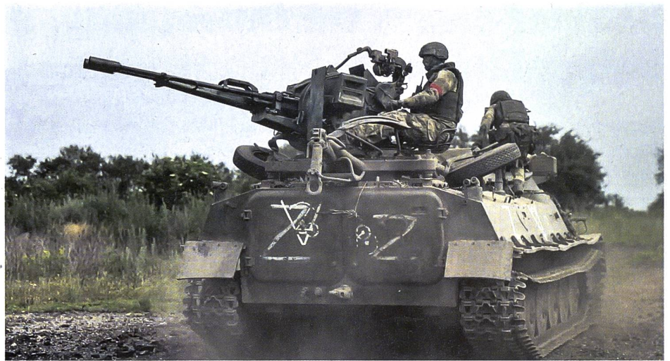
▲ Den russischen Truppen fehlen zur Zeit Flab Waffen gegen Drohnen.

Russlands Anteil an den weltweiten Waffenexporten ist in den letzten Jahren stark zurückgegangen. Hauptgründe sind die westlichen Sanktionen gegen Moskau und die Notwendigkeit des Kremls, die Waffenproduktion mit Priorität für seine laufenden