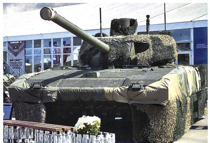
► Kampfpanzer T-14 mit mehrschichtigem Schutz- und Tarnsystem.

Kriegsanstrengungen in der Ukraine auszurichten. Gemäss Aussagen an der Armija-2023 will das russische Verteidigungsministerium seine Truppen in der Ukraine kontinuierlich mit neuen Waffen und moderner Militärtechnik ausrüsten. Entsprechende Beschaffungsaufträge sind denn auch während dieser Veranstaltung von offizieller Seite vergeben worden. Allerdings ist fraglich, ob die russische Rüstungsindustrie in den nächsten Monaten überhaupt in der Lage ist, diese dringend benötigten Waffen in grossem Umfang zu produzieren.