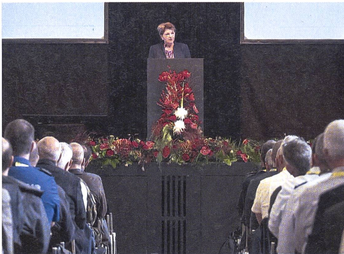
◀ Bundesrätin Viola Amherd eröffnete die Konferenz.

▶ SRF-Korrespondentin Luzia Tschirky schilderte ihre Erlebnisse in der Ukraine bei Kriegsausbruch.