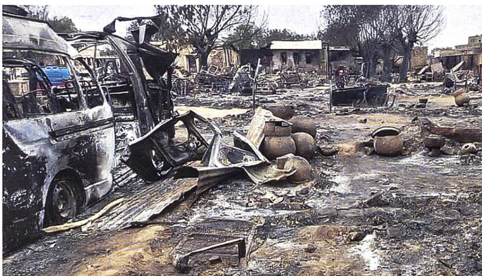
Zerstörung in Al-Fasher, Darfur.

schlimmsten Befürchtungen wahr. Innerhalb von 72 Stunden wurden laut UNO-Berichten mindestens 800 Personen des Masalit-Stammes im Rahmen einer ethnischen Säuberung durch die RSF und ihre Verbündeten in West-Darfur getötet. Den RSF, die aus den islamistischen Janjaweed Milizen hervorkamen, werden nahe Kontakte zu Qatar vorgeworfen. Angeblich wird die Miliz auch durch die prorussische Wagner-Gruppe ausgebildet. Der hohe Flüchtlingskommissar der UNO und damit Vorsteher des UNHCR, Filippo Grandi, warnt vor den Folgen der jüngsten Ereignissen: «Diese schrecklichen Handlungen verdeutlichen erneut das Muster von Missbräuchen im Zusammenhang mit militärischen Angriffen.» Er verweist dabei direkt auf den damaligen Völkermord in Darfur, bei dem zwischen 2003 und 2005 schätzungsweise 300 000 Menschen ums Leben kamen, und warnte davor, dass sich eine «ähnliche Dynamik entwickeln könnte». Seit April wurden mehr als 4,8 Millionen Menschen intern vertrieben und 1,2 Millionen sind in Nachbarländer geflohen. Laut den Vereinten Nationen flohen allein in der ersten Novemberwoche mindestens 8000 Menschen aus dem Sudan nach Tschad. pk