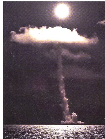
Der Abschuss einer Bulava-Rakete.

endet erklärt und zog die Ratifizierung zurück. Die EU forderte Russland deshalb auf, seine Entscheidung zu überdenken und bekräftigt ihr Engagement für den CTBT. Knapp eine Woche nach dem Rückzug hat Russland erfolgreich einen Test mit einer ballistischen Rakete von einem U-Boot aus durchgeführt, wie die russische Marine bekannt gab. Das U-Boot Karelia feuerte eine Interkontinentalrakete des Typ Bulava ab, die ihr Ziel in der Nähe Kamtschatkas im Osten Russlands traf. Der Test wurde als Teil einer regelmässigen Überprüfung der Einsatzbereitschaft des nuklearen Abschreckungspotenzials durchgeführt. Die Bulava-Rakete ist eine strategische Waffe und kann mehrere Atomsprenköpfe tragen. Sie hat eine Reichweite von bis zu 8000 Kilometern und kann Ziele auf dem gesamten Globus treffen. Dieser erfolgreiche Test soll Russlands Position als eine der führenden Atomkräfte der Welt stärken. Putin setzt offenbar immer mehr auf die nukleare Abschreckung. Denn angeblich habe