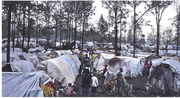
Ein Flüchtlingscamp bei Goma in der Nord-Kivu-Region.

Die Demokratische Republik Kongo steht vor einer beispiellosen humanitären Krise, da die Zahl der Binnenvertriebenen auf ein Rekordhoch von fast sieben Millionen gestiegen ist. Dies geht aus einem Bericht der Internationalen Organisation für Migration (IOM) hervor. Kongo, eines der grössten und bevölkerungsreichsten Länder Afrikas, hat in den letzten Jahren eine Reihe von bewaffneten Konflikten erlebt. Insbesondere in den östlichen Provinzen Ituri, Nord- und Süd-Kivu so-