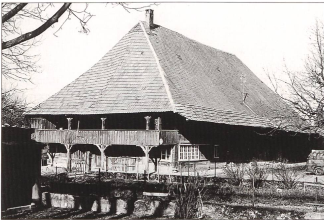
Abb. 1 Zuchwil, Gasserhaus, Ansicht von Südwesten 1976.