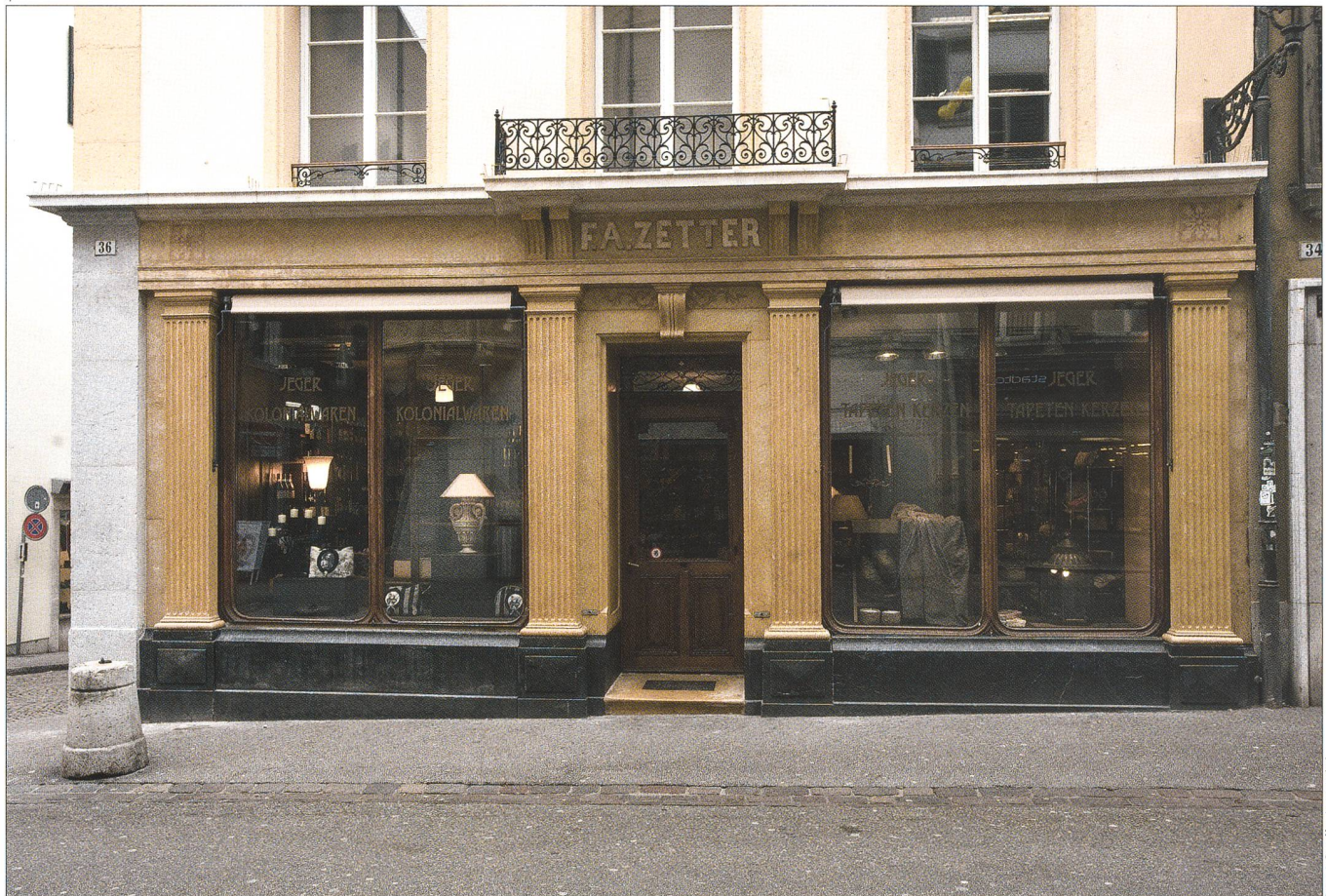
Abb. 4 Ladenfront nach der Restaurierung 2008.

ornamentalen Bemalungen. Besonders augenfällig zeigt sich die Farben- und Materialvielfalt des 19. Jahrhunderts nach der Reinigung der mit Absicht verwendeten, verschiedenartigen Steinsorten der Ladenfront auf der Hauptgasseite. An der Schaalgasse wurden die ehemaligen Kastenfenster und die Kellerabgänge wieder hergestellt.