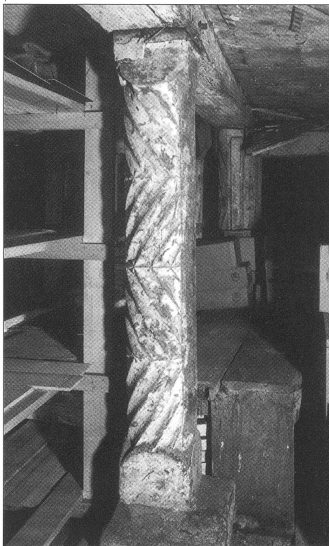
Abb. 1 Solothurn, Hauptgasse 36, Fenstersäule aus dem 16. Jh., heute als Stütze im Keller verwendet.