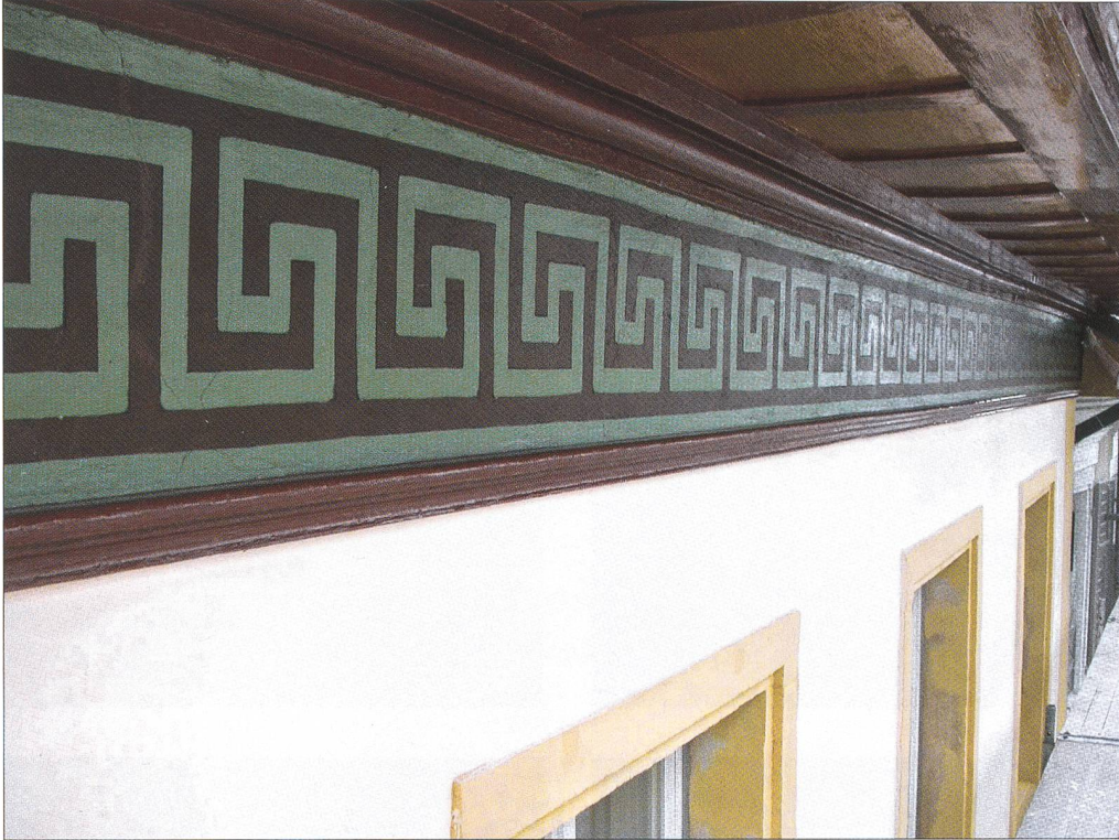
Abb. 5 Dachuntersicht und Fries nach der Restaurierung 2008.