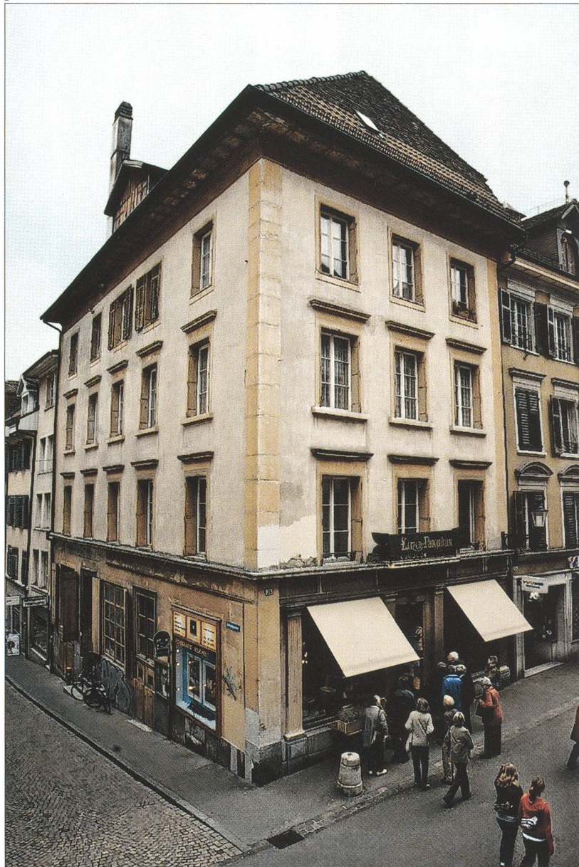
Abb. 2 Zustand vor der Restaurierung 2008.