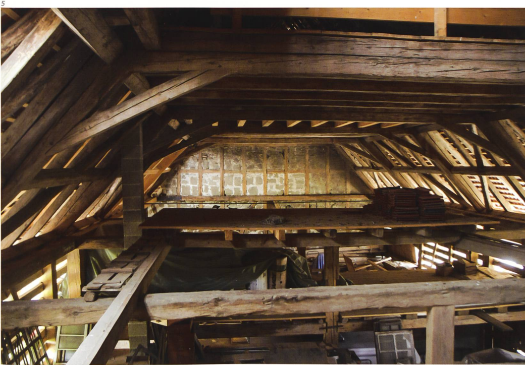
Abb. 5 Blick vom Dachboden des Wohnhauses über den Heustock des Ökonomieteils auf die Rückwand des Gesinde- wohnteils.