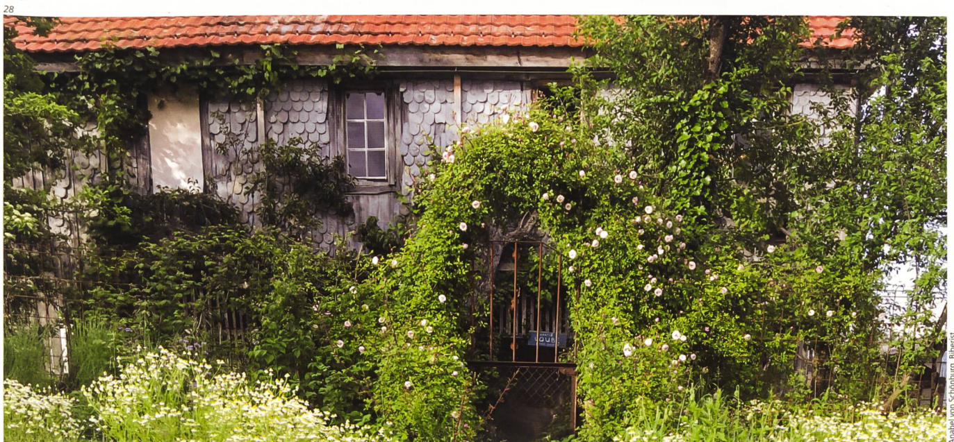
Abb. 28 Klassische Bauerngartensorten oder doch eher historische Rosen? Gartenplanung hat im Umschwung des historischen Hauses plötzlich eine neue Dimension bekommen.

Natürlich gab es auch bei uns Ausnahmen von der Regel der Minimalinvasion, wenn der Erhaltungszustand keine Konservierung zulies oder der Preis der Konservierung ein Vielfaches des Ersatzes ausgemacht hätte. In allen Zimmern des Obergeschosses waren die Decken, in manchen Zimmern auch die