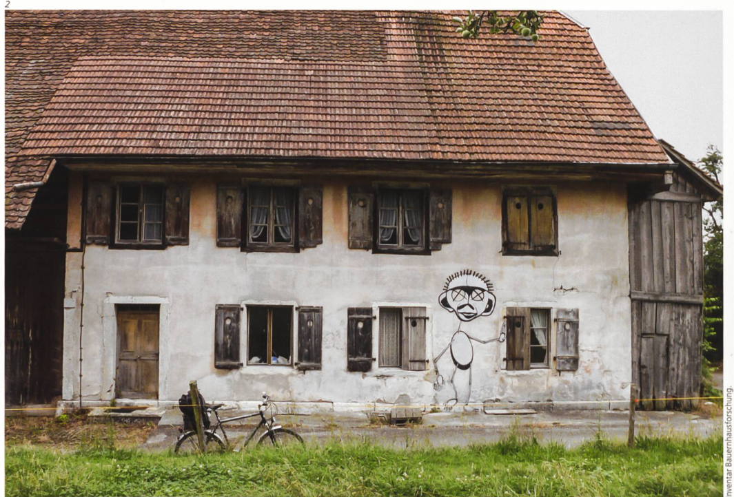
Abb. 3 und 4 Der rechteckige Brunnen nördlich des Stalltrakts wurde aus einem Stück Jurakalkstein gehauen. Links nach der Restaurierung, rechts Vorzustand mit Bruchstücken des eingestürzten Vordachs.

Stalltrakt schon früh ein weiterer Stall und darüber ein zweigeschossiger Gesindewohnteil angehängt. Nördlich liegt ein grosser, rechteckiger Brunnen aus Jurakalk, geschützt unter dem hier weiter auskragenden Dach. Direkt daneben die Weggabelung Bleichenberg-Biberist-Emmenbrücke, früher wie heute ein Ort der Rast auf dem Weg über den Hügel, es gibt kühles Trinkwasser und den Schatten der grossen Linde. Die Bromeggstrasse wird im SOGIS, dem Geoportal des Kantons, unter Verkehrswege als «historischer Verlauf mit Substanz» geführt, was stark vereinfacht bedeutet, dass dieser Weg in unserer Kulturlandschaft schon lange genutzt wird – wie auch der Hof.