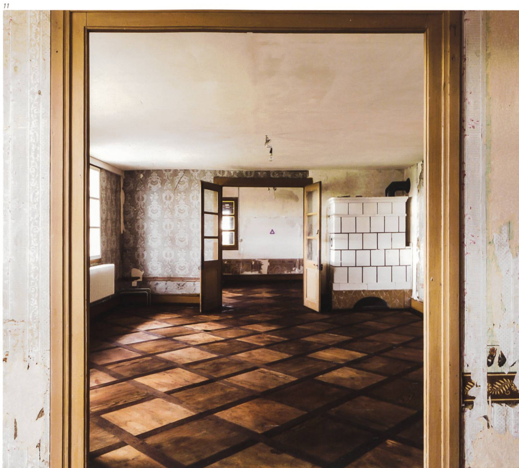
Abb. 13 Der Ofen mit weiss glasierten, schwarz umrandeten Kacheln wurde den heutigen Feuer-schutzbestimmungen entsprechend neu gesetzt und ist wieder in Betrieb.

Abb. 11 und 12 Im Obergeschoss verbinden ein Felderparkett und Türen mit grossen Glasfenstern die beiden kleinen Zimmer mit dem grossen Salon. Die Grundrisseinteilung wurde nicht verändert. Aufnahme oben vor, unten nach dem Einzug.