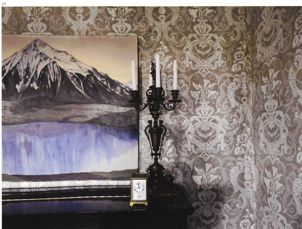
Abb. 17–21 Detailaufnahmen der in situ konservierten Tapeten in Stube und Kinderzimmer des Ober- geschosses.