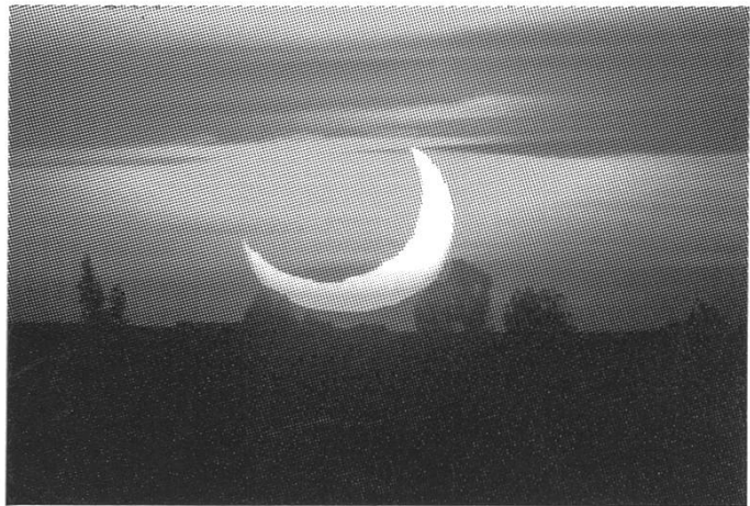
Abb. 3: Gegen 19:19 Uhr GMT zeigte sich eine durch die atmosphärische Schichtung stark verzerrte Sonnensichel. Belichtung \frac{1}{500} s, sonst wie Abb. 1.

Um 17:41 Uhr Lokalzeit – Marokko hat Greenwich Mean Time (GMT) ohne Sommerzeit – hatte ich einen kurzen Gedanken an meine Freunde in der Schweiz, die eben den ersten Finsterniskontakt verzeichnen konnten. In Marokko dauerte es noch eine knappe Viertelstunde länger, bis der unsichtbare Rand des Mondes in die Sonnenscheibe trat. Dann, um 17:52.1 Uhr GMT (19:52.1 Uhr MESZ), war es soweit; die partielle Finsternisphase nahm ihren Anfang. Durch das Teleskop betrachtet (vorherst noch mit aufgesetztem Schutzfilter), war das Vorrücken des Erdbegleiters ausserordentlich schnell,