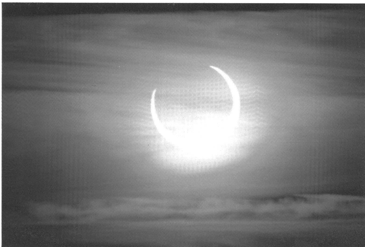
Abb. 2: Anderthalb Minuten nach Ende der Ringphase war bereits wieder eine weit geöffnete Sichel zu sehen. Belichtungszeit \frac{1}{1000} s, sonst wie Abb. 1.

Jetzt begann das lange Warten. Noch dauerte es drei Stunden bis zur Finsternis. Je mehr sich das Tagesgestirn gegen den Horizont senkte, desto gewisser konnte ich sein, zum erstenmal in meinem Leben Zeuge einer grossartigen Sonnenfinsternis zu werden. Schon früher habe ich mir vorzustellen versucht, wie das Ereignis einer ringförmigen Sonnenfinsternis wohl sein wird, wie sich Landschaft und Himmel verändern würden und ob die Planeten Venus und Merkur zur Zeit des Maximums sichtbar wären. Doch, zugegeben, eigentlich konnte ich mir all das – trotz zweier totaler Finsternisse –