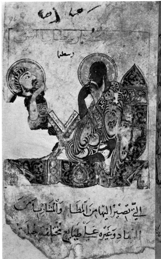
Abb. 2. Darstellung des Aristoteles und Ibu Bukhtishû c (Fol. 94a).