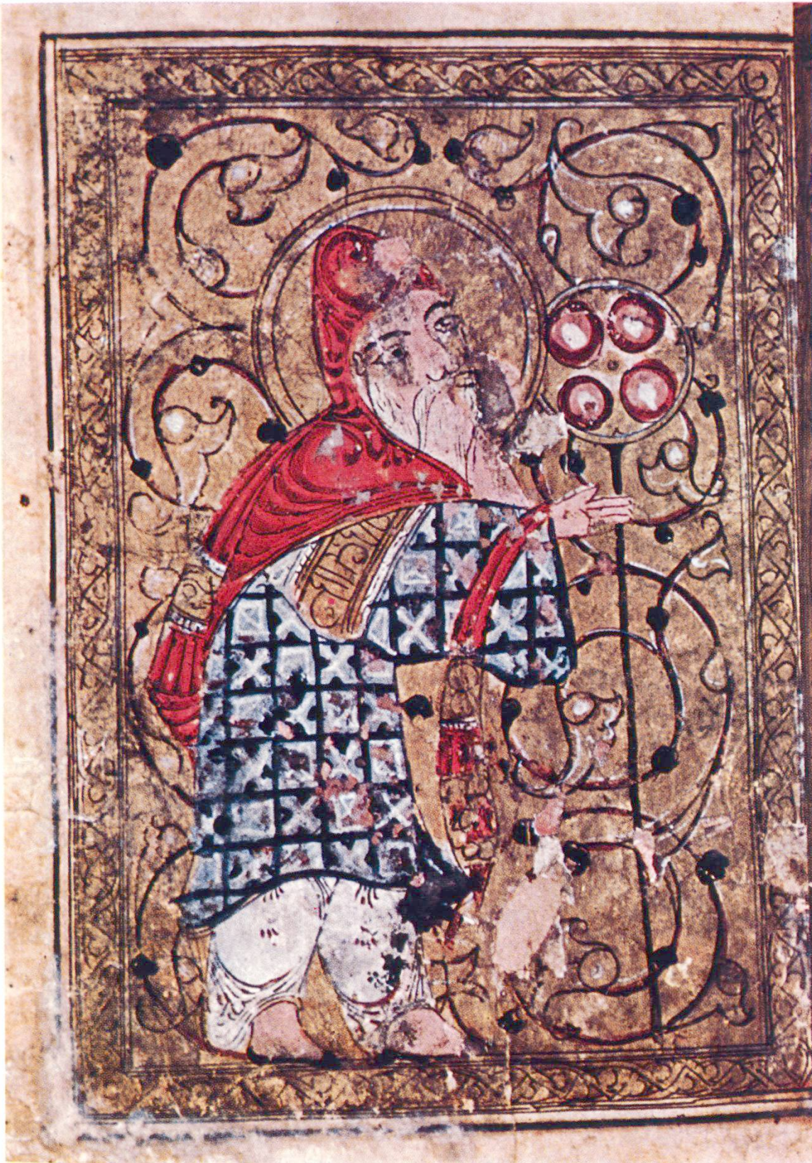
Abb. 1. Aristoteles der Weise (Fol. 96 a).

Die Kosten trägt ein großzügiger Gönner.