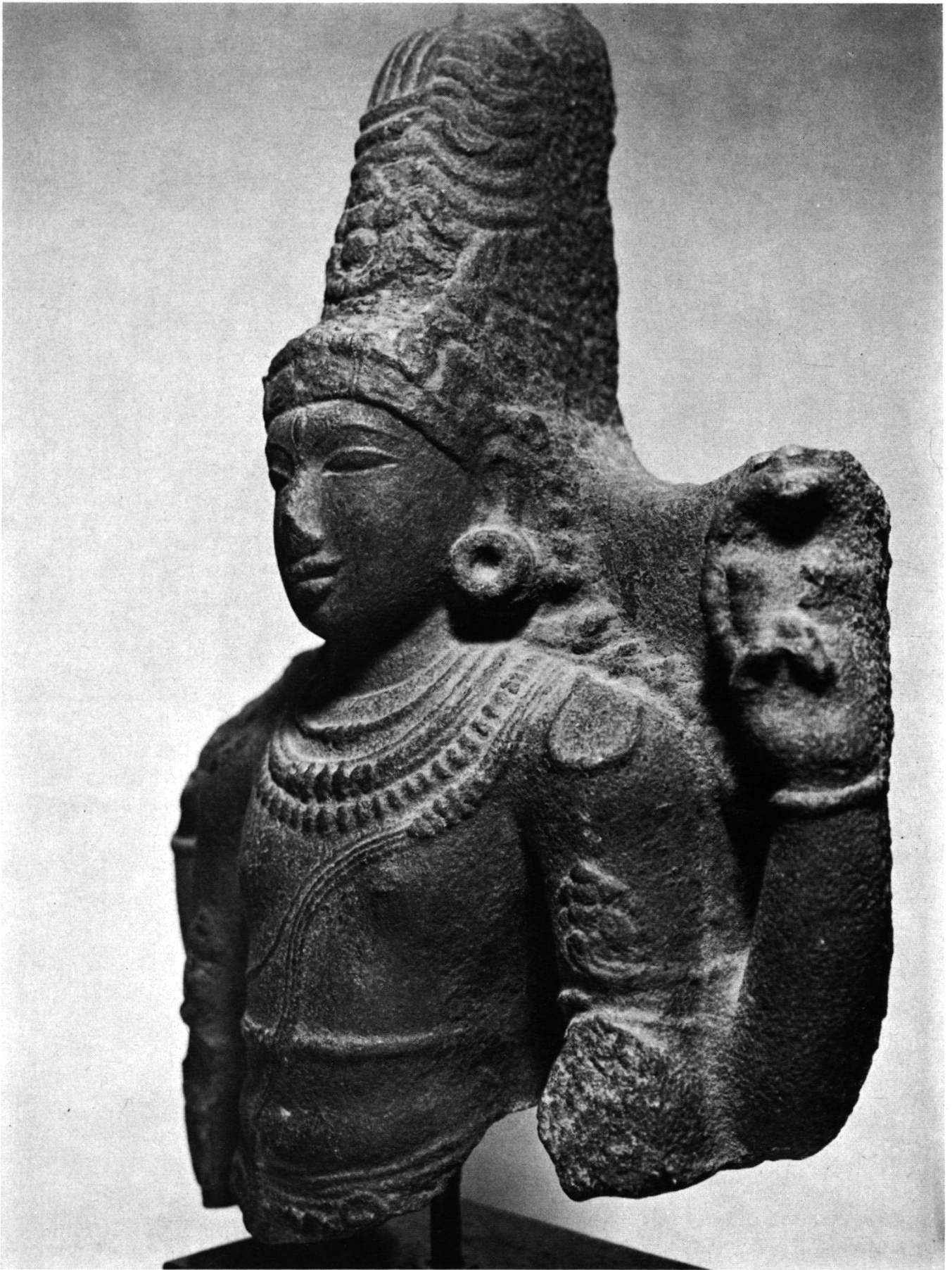
Abb. 6. Shiva-Büste aus Granit, vierarmig, mit Antilope. Chola-Dynastie, 11. Jh. Südindien. 54 cm.