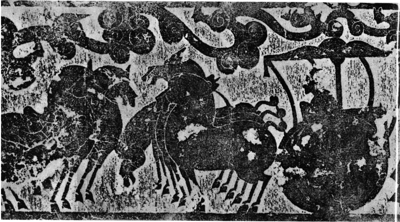
Abb. 4. Steinabreibung (Detail) von den Wänden einer Opferkammer im Grabbezirk der Beamtenfamilie Wu in Shantung, China. Han-Dynastie. (Geschenk von Frau H. Flory-Fischer, zur Erinnerung an ihren Vater, den Sinologen Prof. Dr. Otto Fischer.)