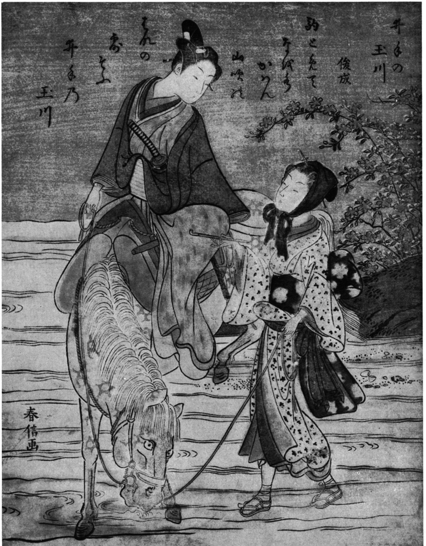
Abb. 2. Tamafluß von Ide , Farbholzschnitt von Suzuki Harunobu. Zeit um 1768. 28,5 × 21,5 cm. Japan. Das Thema ist, der Aufschrift zufolge, den Gedichten «Die sechs Tamagawa-Flüsse» entnommen. Die Dame mit dem Kopftuch begleitet einen Jüngling zu Pferd und überreicht ihm eine Pfeife. (Geschenk von Herrn Julius Mueller.)